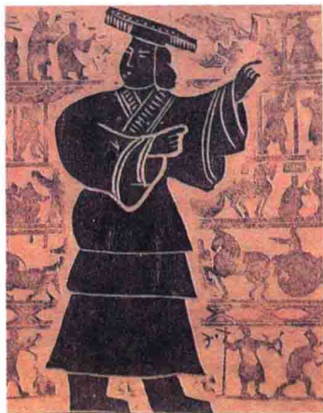
中华民族的先祖——黄帝像