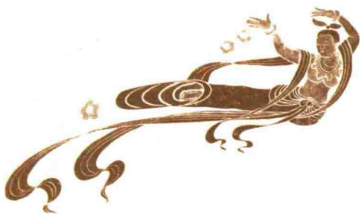
1300多年前的中国敦煌散花飞天画像。