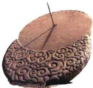
日晷，是中国古代利用日影测得时刻的一种计时仪器。

中国古代的旌旗由多条叫作“旒”（liú）的飘带组成。甲骨文、金文的“中”字，描绘的是有长长飘带的旌旗随风飘动的样子，旗杆中心的那个圆形或方形物是竖扎的木块，可以增加旗杆抗折的强度，这个木块叫作中。