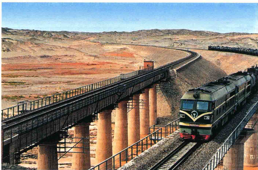
Поезд к Синьцзяну

После проведения политики реформы и открытости в 1978 г., западный участок железной дороги Лан-Син