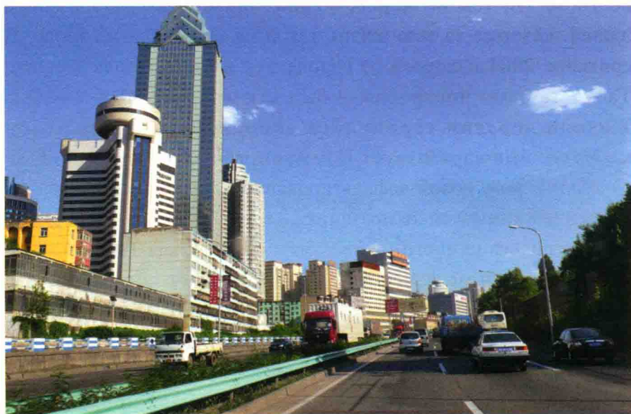
Городские улицы в Урумчи

Именно это чудо принесло возможность для развития прилегающих районов. В 2002 г. пустынная дорога распространялась до уезда Черчена Баянгол-Монгольского авт. округа, и правительство немедленно мобилизовало крестьян урегулировать структуру растениеводства, чтобы посадочная площадь унаби ежегодно увеличивалась на 12 тыс. му (мера земельной площади, равная 60 квадратным чжан 畝, что соответствует приблизительно 0,07 га). Десять лет спустя, территория посадки унаби достигла