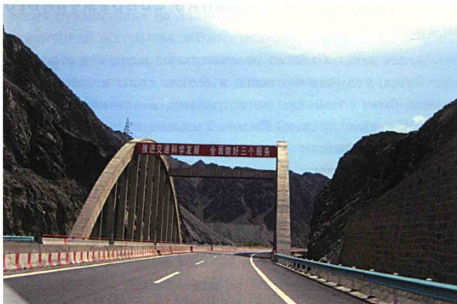
Скоростная магистраль извивается между горами

Повышение качества автодорог не только улучшает пропускную способность дорог, но и приносит жителям большую пользу. На скоростных автотрассах появились полностью оборудованные зоны обслуживания с автостоянками, ресторанами, местами отдыха, общественными туалетами и так далее.