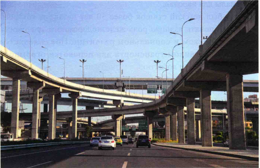
перестройка дороги Тяньцзылу в Урумчи

143 тыс. му, валовая продукция унаби составляет 15 тыс. т, и стоимость производства унаби — 290 млн. юаней. Треть чистой прибыли (4 тыс. юаней) на душу сельского населения идёт от продажи красного унаби. По чудотворной пустынной дороге, в тот же день свежий унаби из уезда Черчена может быть доставлен в Курлы, столицу Баянгол-Монгольского авт. округа, и в Урумчи к полудню следующего дня.