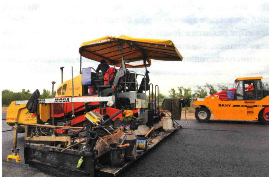
Строительство шоссе Чанци

очень сложная из-за дабана, высота которого выше 4 км. В то время путешествия на длинные дистанции были опасны из-за изменчивой погоды на дабана, поэтому, перед въездом купцы написали завещание, попрощались со своей семьей, как навсегда. А когда поднималась метель, к сожалению, ни люди, ни товары не могли спастись. Путешествовать весной и осенью было невозможно из-за сильных дождей, и пути были размыты в городе Дихуа (сегодняшний Урумчи), Инин и других городах.