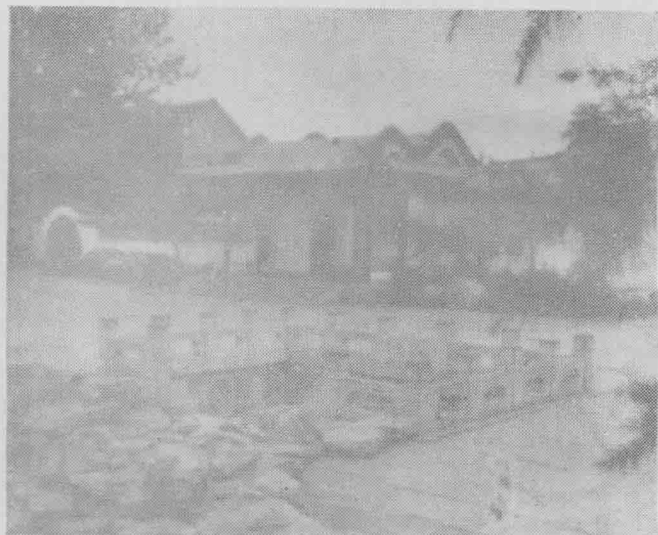
山东济南李清照纪念堂