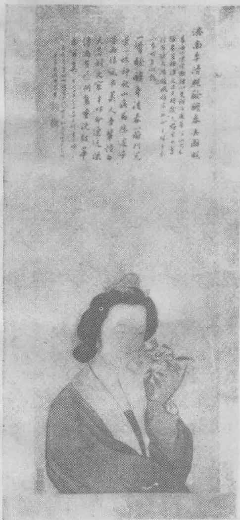
李清照醉醺春去图照