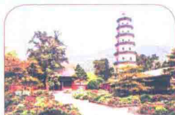
太原及周边 PP.70 ~ 133