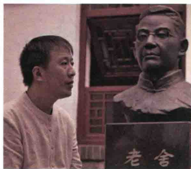
魏新，文化学者，全国青联常委， 央视《百家讲坛》主讲人。