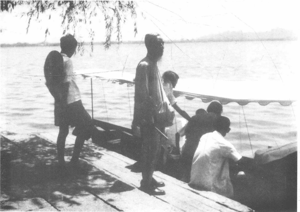
丰子恺与家人在杭州游西湖