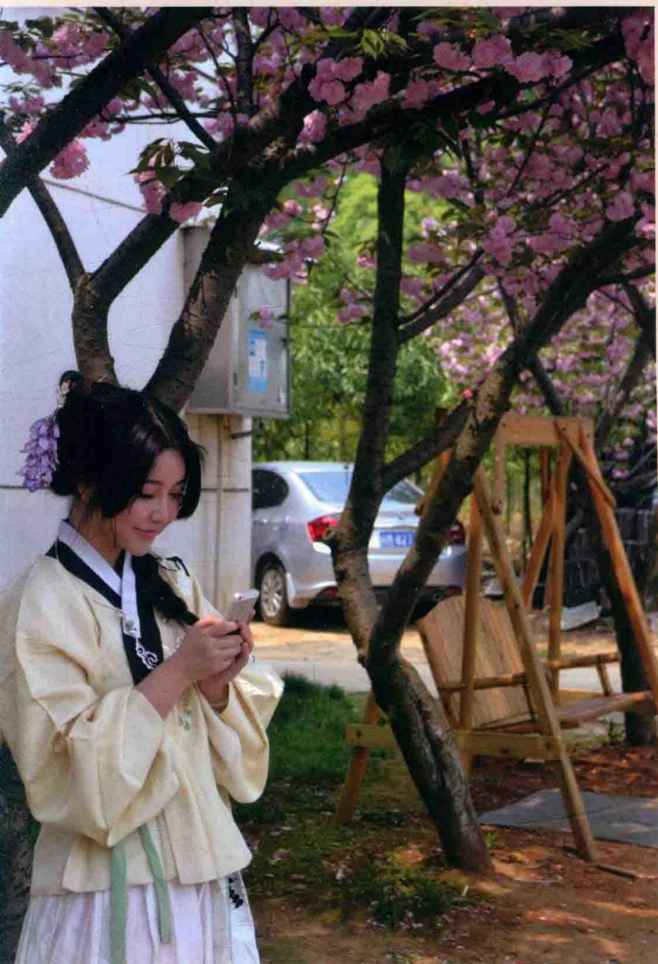
【江西·南昌·林科院】 灵芝姬：袄裙（清辉阁）