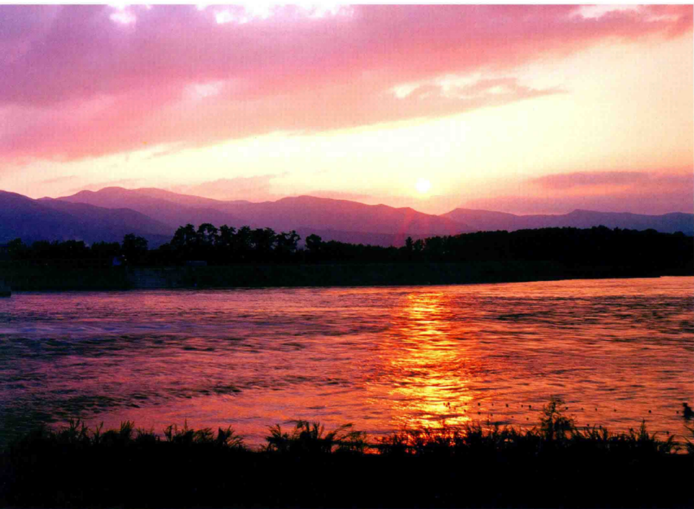
■ 绿色能源业之一——西江水利枢纽工程