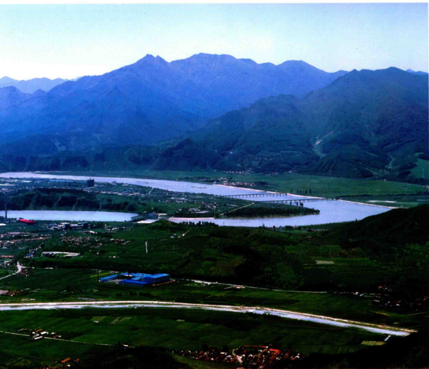
■ 中国易学标本地——天然太极图