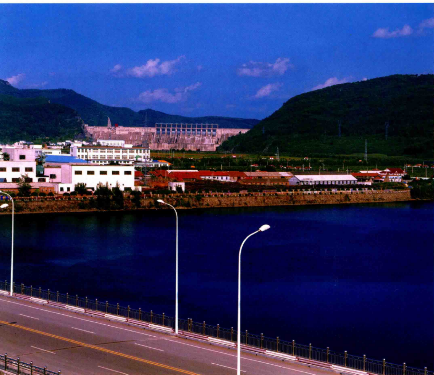
■ 北江生态产业园区