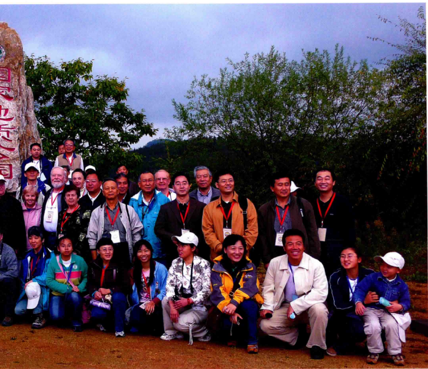
■ 座落在国家地质公园内的五女山山城于2004年7月1日被列入《世界遗产名录》后蜚声中外