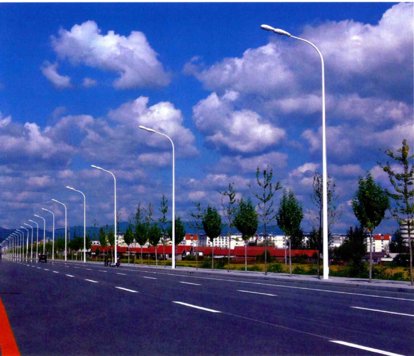
■ 城镇建设日新月异——新建长江大街