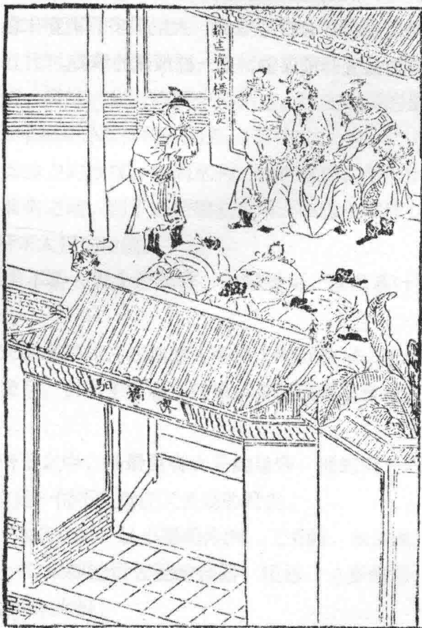
赵匡胤黄袍加身，选自《南宋志传》。