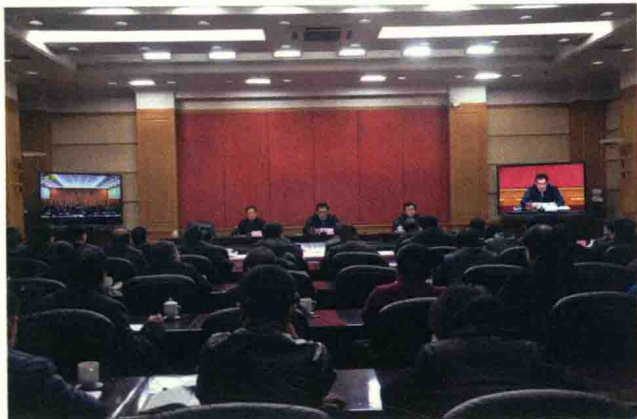
2016年1月22日山西省召开国有林场改革工作电视电话会议（作者提供）

3000 万亩以上；活立木蓄积由现在的 7900 万立方米增加到 1 亿立方米以上；国有林场范围内的宜林荒山全面绿化，实现增绿量、增覆盖、增蓄积、增景观、增效益。到 2030 年，国有林场对全省森林覆盖率的贡献率由目前的 11 个百分点增加到 20 个百分点，“三加强”，就是要全面加强资源保护与培育，全面加强资源管理，全面加强基层基础建设。