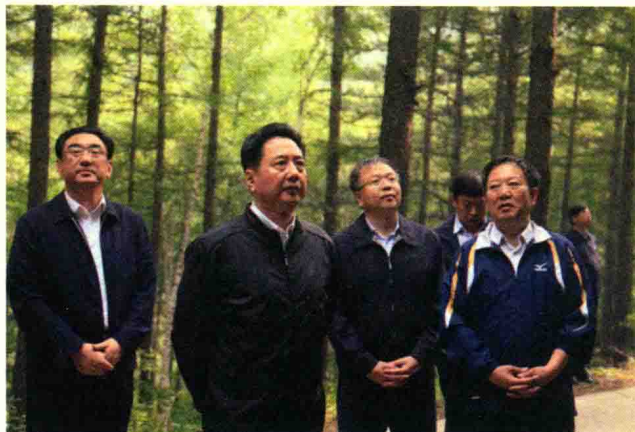
2015年7月8日，山西省省长李小平专题调研国有林场改革

监局、国土厅、环保厅和省总工会等12个部门，11个市、96个涉及国有林场的县，以及9个省直林局的意见，反复修改完善，六易其稿，最终形成《实施方案》。《实施方案》全面贯彻落实党中央、国务院关于深化国有林场改革、加快推进生态文明建设的一系列部署和要求，紧密联系我省实际提出了国有林场改革的目标和任务，2015年9月8日，经山西省人民政府第97次常务会议通过，10月8日经山西省委全面深化改革领导小组第十三次会议审议通过。12月16日，国家发改委、国家林业局以发改经体〔2015〕2977号文批复实施。