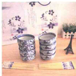
图1-12 了解拍摄商品外观与外包装