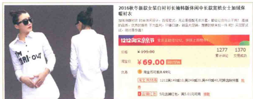
图1-3 销量较高的棉麻衬衣