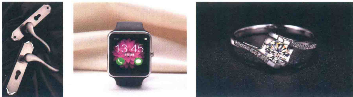
图1-1 高品质的商品图片

网店中的商品图片不仅要清晰真实地表现商品的特点，还要能刺激买家的购买欲望。因此，对于卖家而言，必须要精心设计拍摄方案，将商品的整体效果与需要展现的卖点传达给买家，使自身在众多网络卖家中具有竞争力。除此之外，还可通过图像处理软件，将图片处理得更具视觉冲击力与品质，以提升店铺的整体形象，扩大买家的认知率并促进转化率，最终提高店铺的销量。图1-1所示为几张高品质的商品图片。