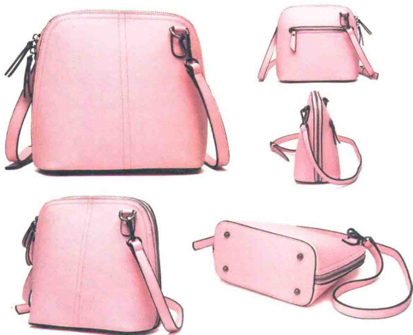
图1-8 多角度商品图片