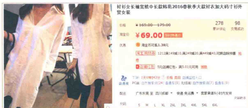
图1-2 销量一般的棉麻衬衣