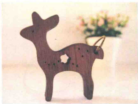
图1-4 清晰干净的主体物