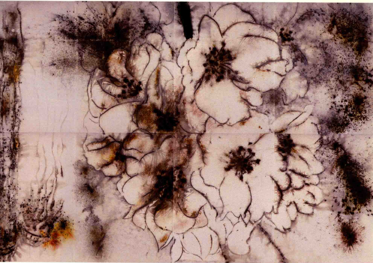
a. 《夜樱》局部 / 2015/ 火药, 纸 800 cm × 2400 cm 艺术家本人收藏

2015年7月,蔡国强在横滨美术馆举办了个人展览,这距离他上一次的日本个人画展已有7年时间。此次个人画展的主题是“归去来”。个展里展示了他至今为止的作品里最大的一幅火药画,名为“夜樱”。