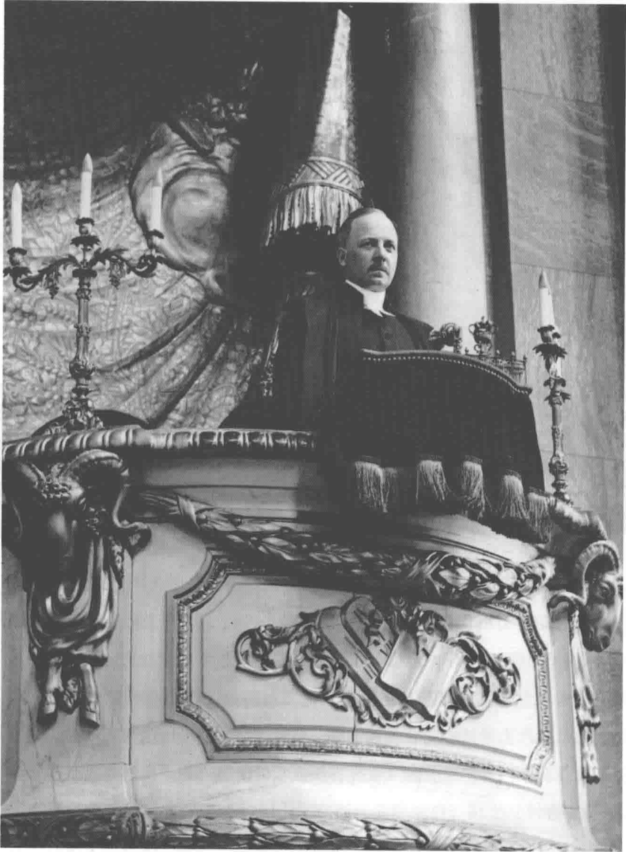
父亲在斯德哥尔摩海德魏格·艾柳诺拉教堂讲道台前的留影