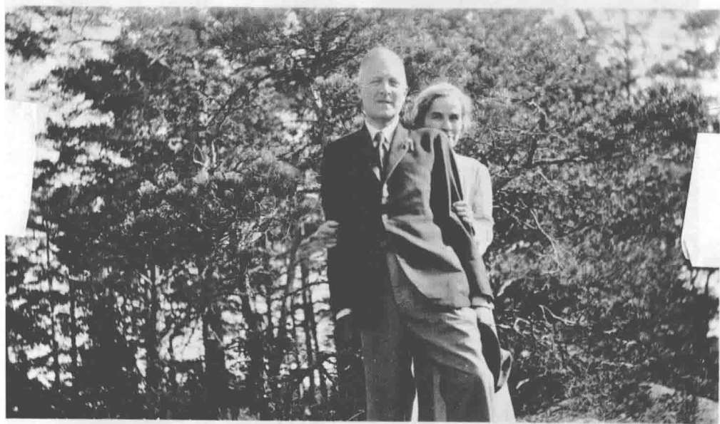
母亲卡琳·阿克布卢姆和父亲埃里克·伯格曼于1919年结婚。他们的婚姻一直维持到1966年3月卡琳在斯德哥尔摩的去世。埃里克·伯格曼则于四年后去世于斯德哥尔摩索菲亚医院