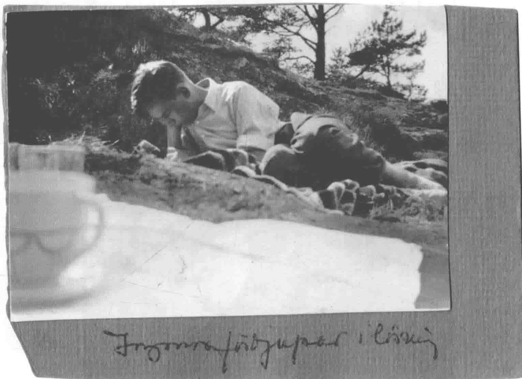
年轻的伯格曼在读书