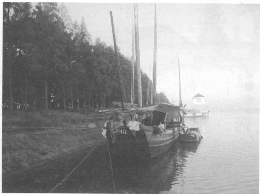
太湖一角