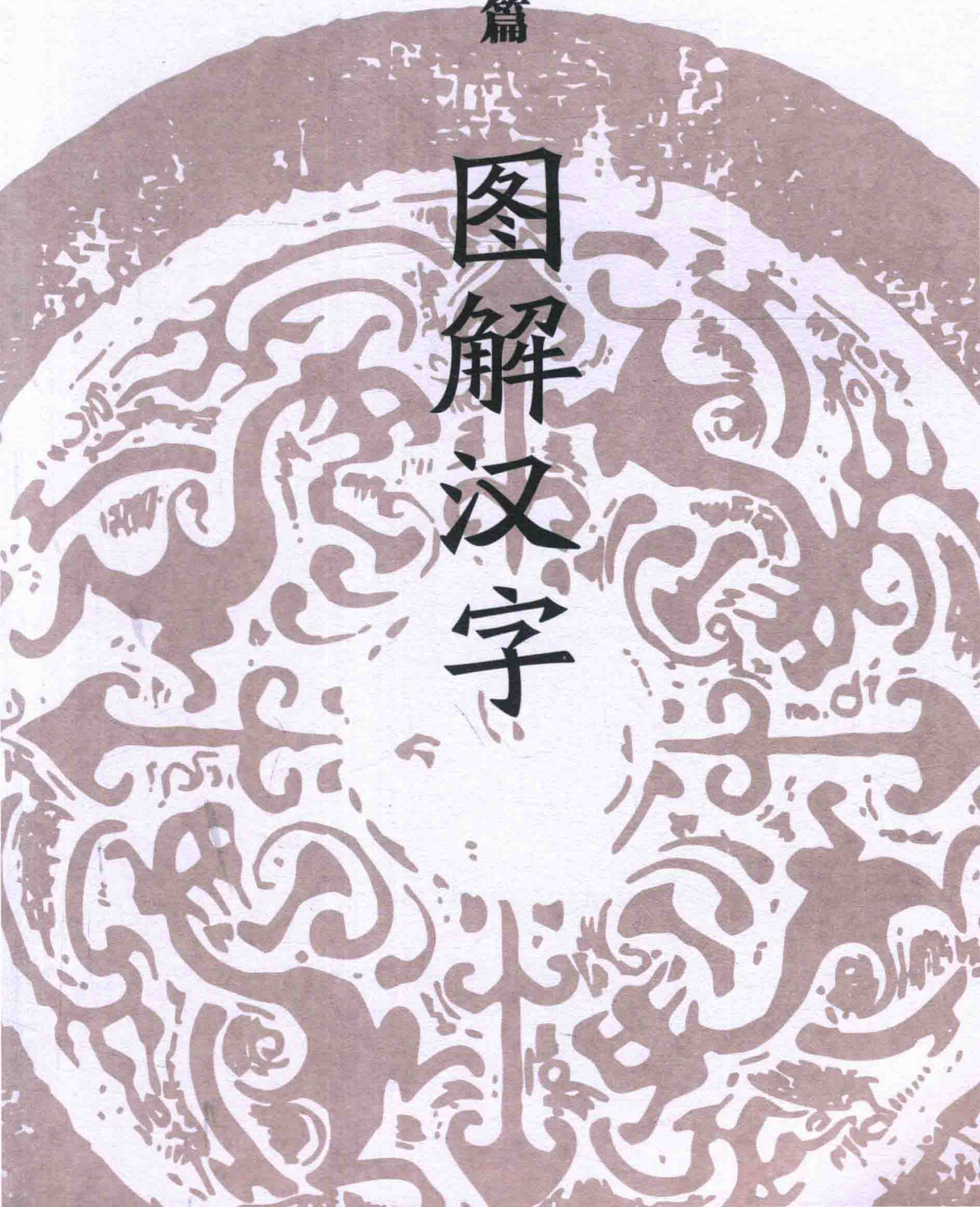
图 解 汉 字