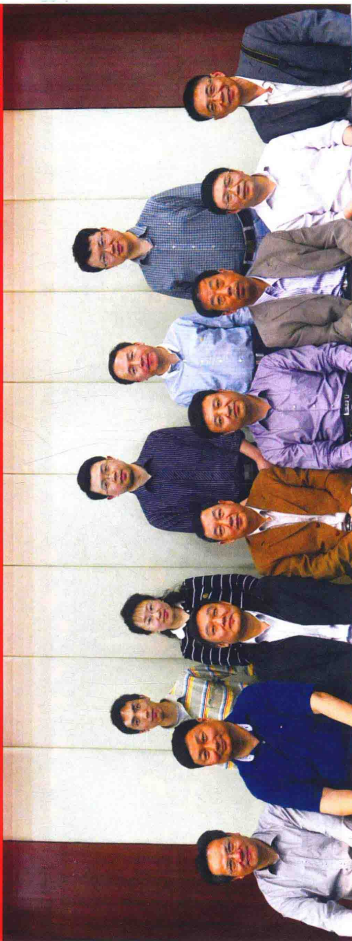
《中华战创伤学》第一次主编会议参会人员合影