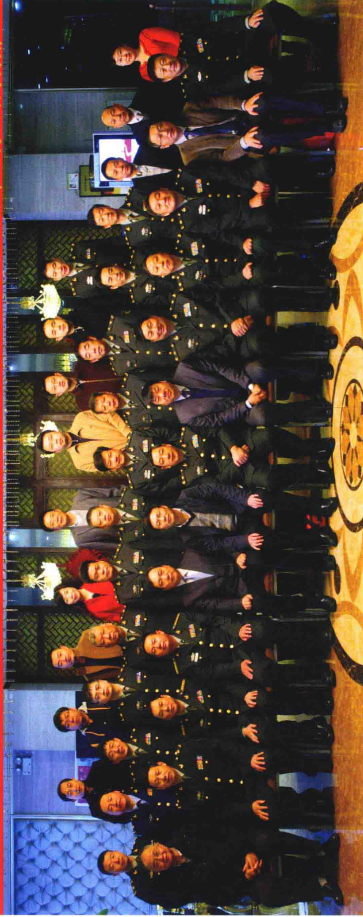
《中华战创伤学》第三次主编会议参会人员合影