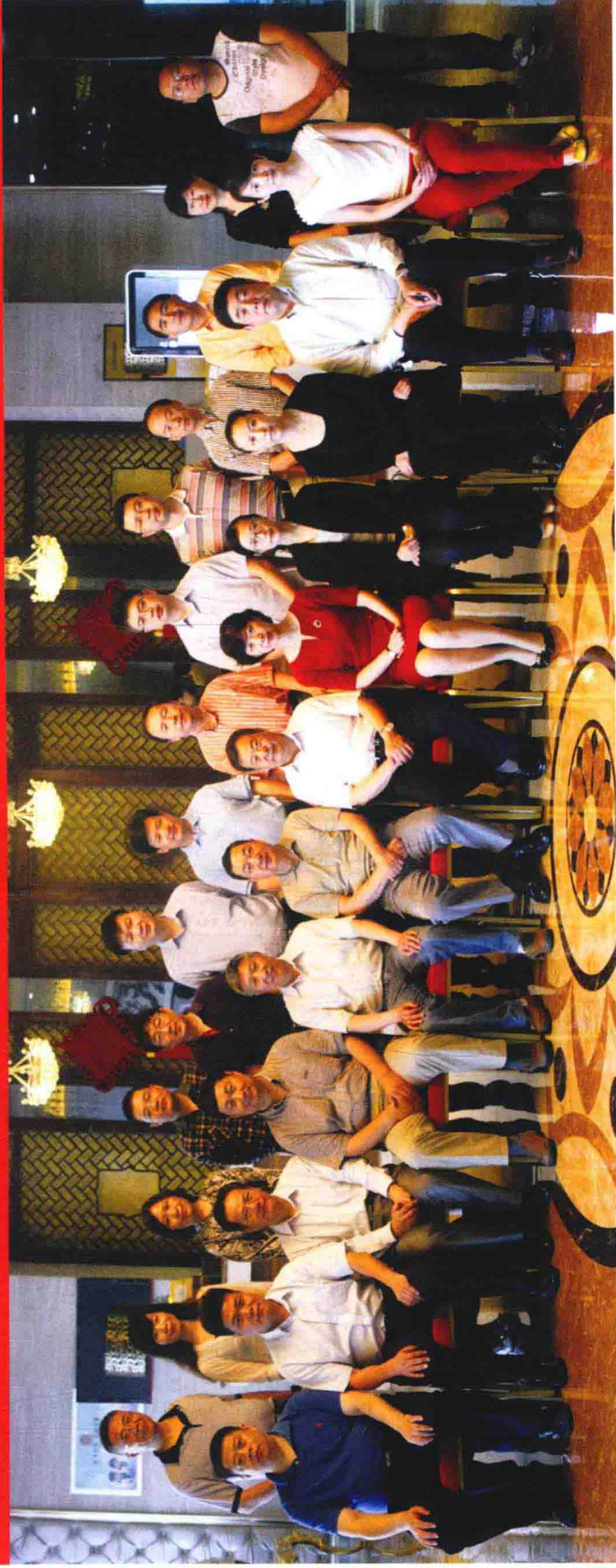
《中华战创伤学》第二次主编会议参会人员合影