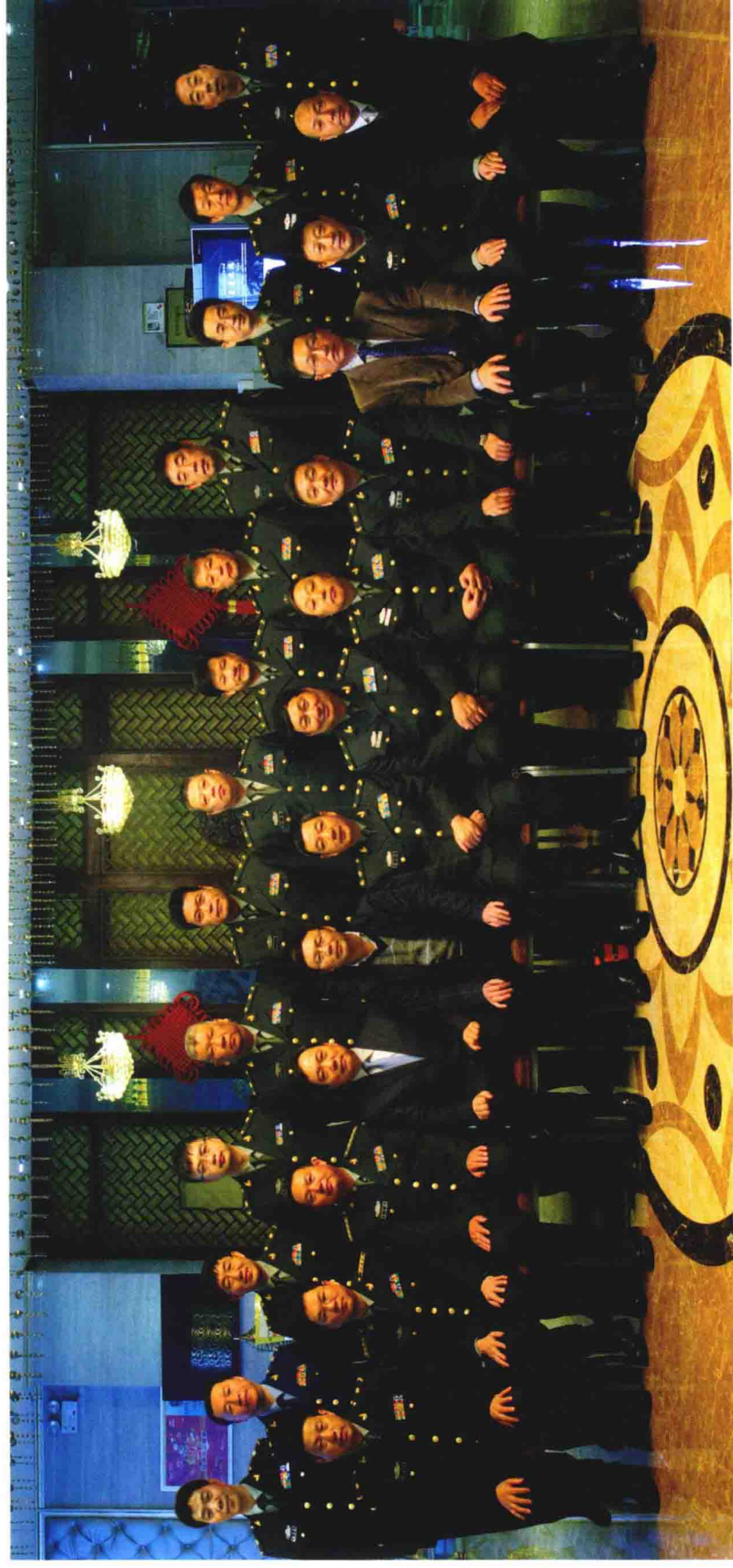
《中华战创伤学》总主编付小兵院士与分卷主编合影