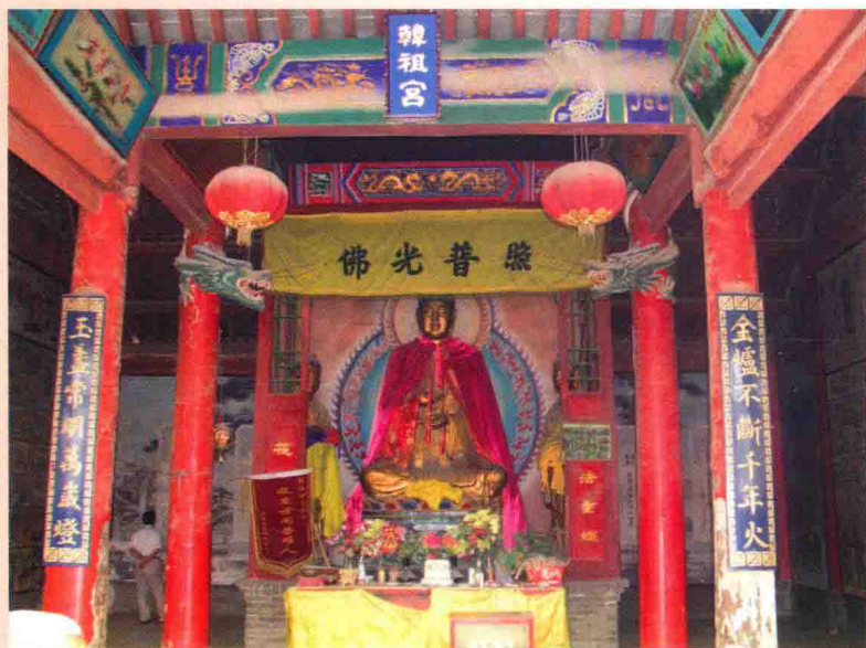
韩祖宫无生老母塑像