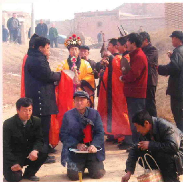
太上门教请圣仪式