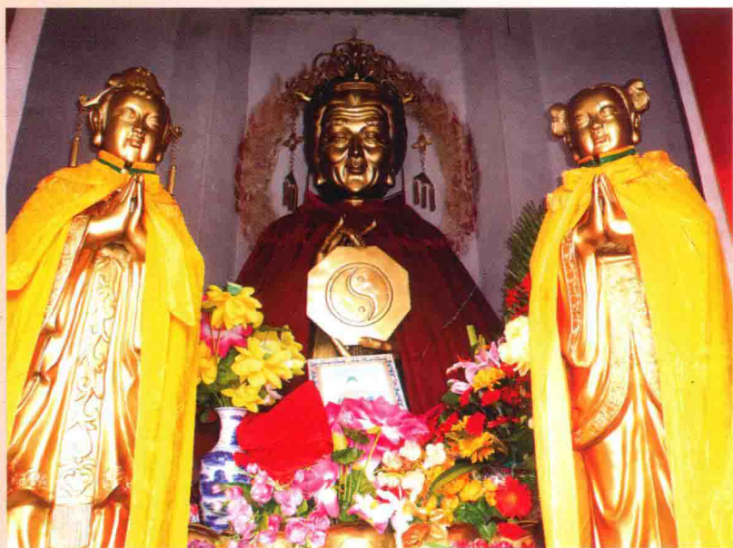
国营观音寺无生老母塑像