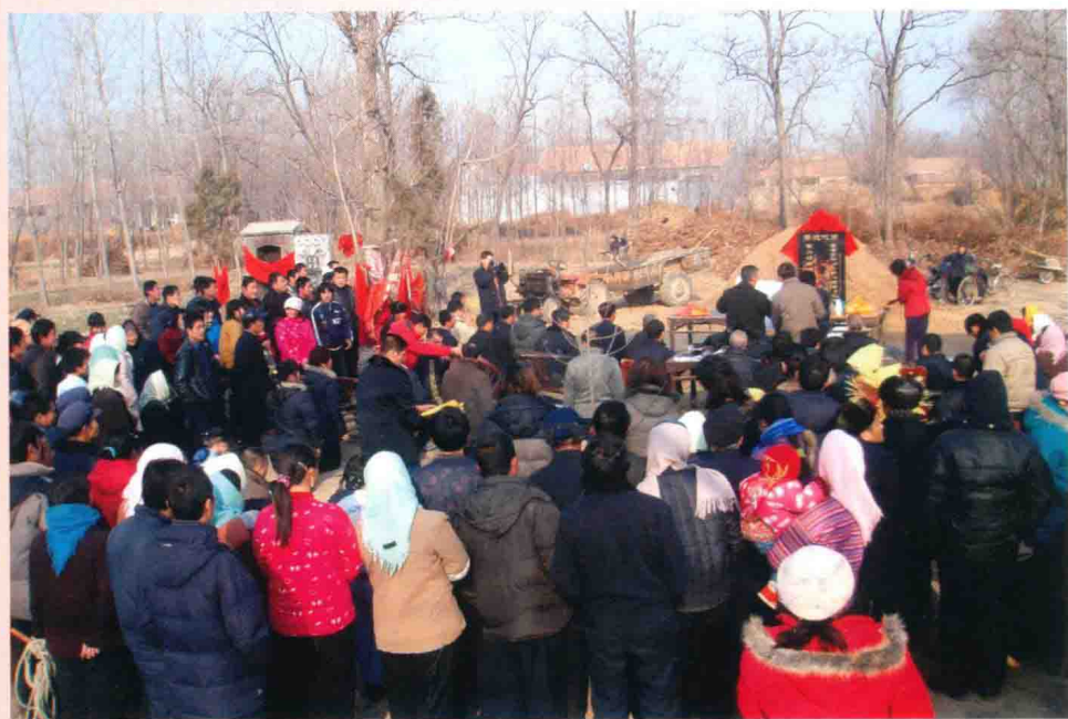
天地门教信众在董家林举行重修董老师墓法会