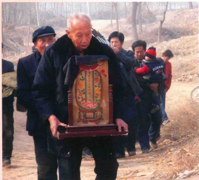
天地门教请圣仪式