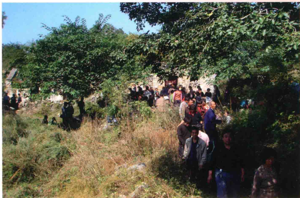
行走在杓峪山上的天地门教信众朝拜队伍