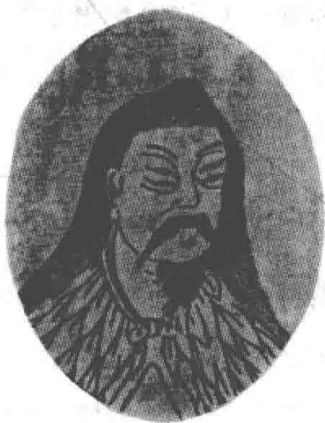
图 1 仓颉画像

位学者叶梦得（公元 1077—1148 年），写了一部笔记叫《石林燕语》，其中还谈到当时京都官府中许多管理文书的小官吏，到了秋季就集体祭祀仓颉，把他尊为文字之神（图 1）。