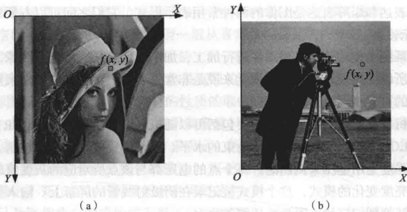
图 1.2.2 标准图像显示示例

图 1.2.2 所示为两幅典型的灰度图像, 它们都是常用的公开图像, 或称标准图像。图 1.2.2 (a) 所用的坐标系常在屏幕显示中采用 (屏幕扫描是从左向右, 从上向下进行的), 它的原点 (origin) O 在图像的左上角, 纵轴标记图像的行, 横轴标记图像的列。 f(x, y) 既可以代表这幅图像, 也可以表示在 (x, y) 行列交点处的图像值。图 1.2.2 (b) 所用的坐标系常在图像计算中采用, 它的原点在图像的左下角, 横轴为 X 轴, 纵轴为 Y 轴 (与常用的笛卡儿坐标系相同)。同样, f(x, y) 既可代表这幅图像, 也可表示在 (x, y) 坐标处像素的值。