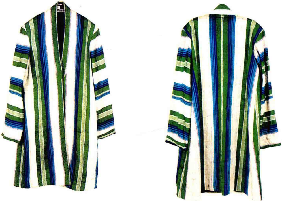
传统彩条外套（袷袂）

维吾尔族男子的衬衣多为套头、半开襟，长及膝部、臀部。年轻人及小孩的衬衣在领口、胸前、袖口等处绣花或缀花边。宗教职业者多用长的白布缠头，维吾尔语称为“赛兰”，外衣外面不系腰带，多穿长袍，与一般人有明显的区别。