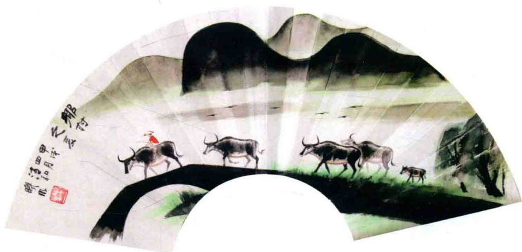
林曦明扇面：乡村之夏