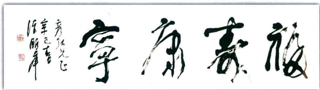
陈鹏举题：福寿康宁