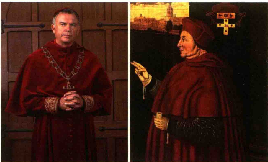
剧中的沃尔西红衣主教（左）与历史肖像画（右）

1 托马斯·沃尔西，英国政治家 and 红衣主教，曾任英王亨利七世和亨利八世的宫廷司铎，亨利八世的大法官和主理国务的大臣。