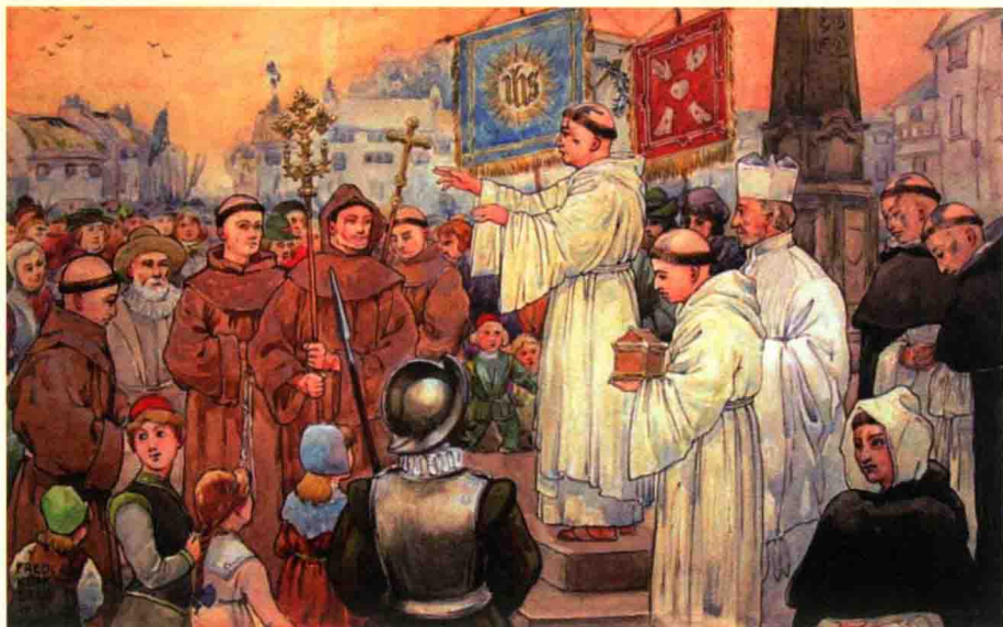
求恩巡礼 (Pilgrimage of Grace)

(Pilgrimage of Grace)”起义 1 ，就是在圈地运动中日益贫困、又失去宗教精神慰藉和教会慈善救济的下层民众的绝望反抗。解散修道院还意味着中世纪数百年历史的哥特式建筑被毁坏、价值不菲的贵金属器皿被熔化、珍宝被变卖、图书馆被洗劫，是英国文化艺术史上的一场空前的浩劫。这些宗教改革活动给社会带来的严重后果，托马斯·莫尔(Thomas More)曾通过其名著《乌托邦》向同时代的人提出过警告，不过他生前来不及看到自己的预言实现。