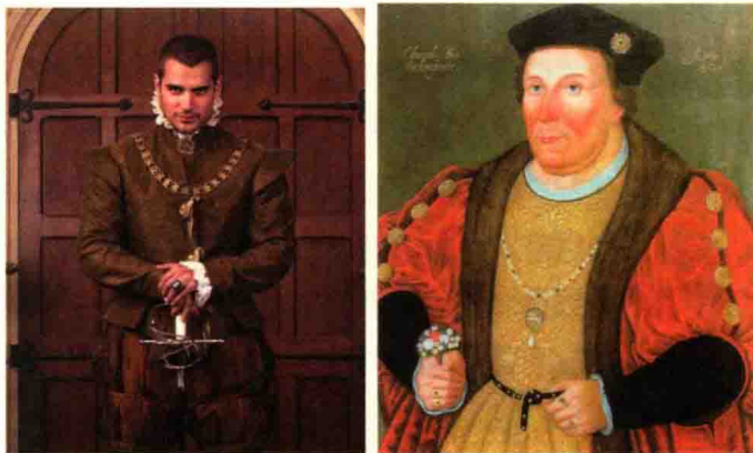
剧中的查尔斯·布兰登（左）与历史肖像画（右）

1 12世纪出现最初类似依附于贵族的奴仆。后来，成为比武会上的司仪，运用纹章知识识别骑士出身，宣布比武项目与骑士名单。到了14世纪，纹章官权力有所扩大，15世纪后期纹章院建立，代表政府授予贵族纹章。