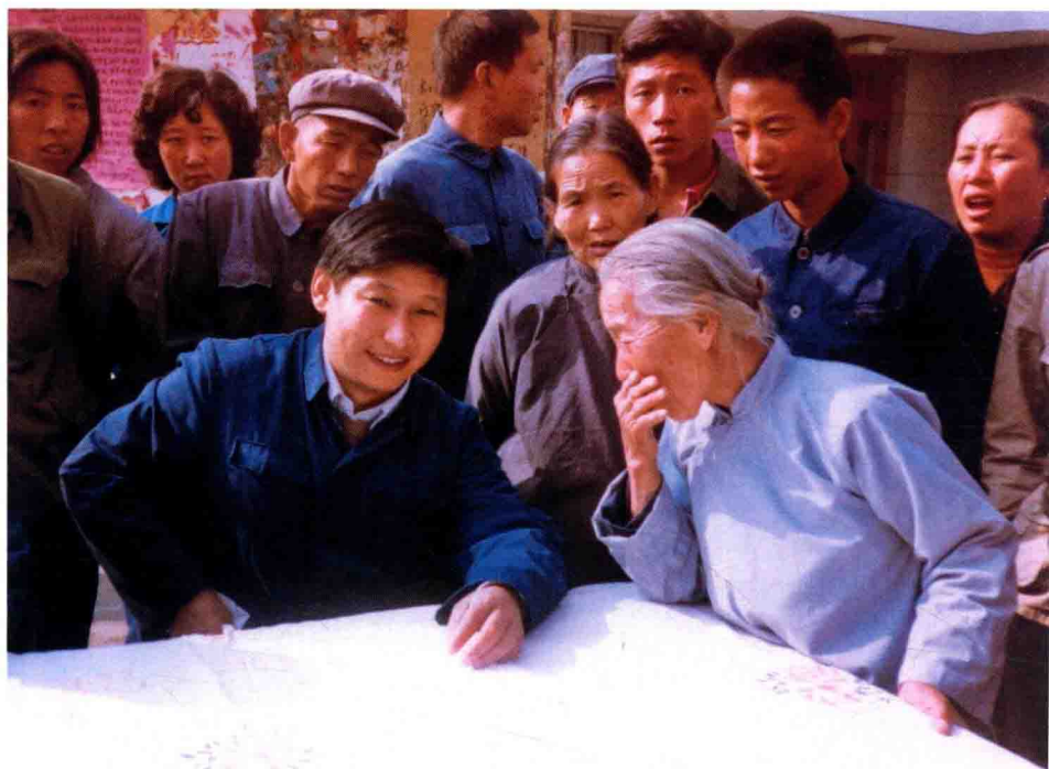
En 1983, Xi Jinping, secrétaire du Comité du Parti pour le district de Zhengding dans le Hebei, écoutant les opinions des masses populaires dans la rue.