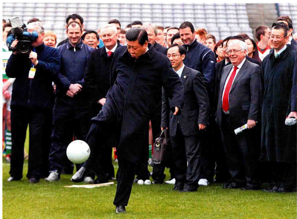
En février 2012, Xi Jinping, vice-président de la République populaire de Chine, donnant le coup d'envoi d'une balle à Gaelic Athletic Association, lors d'une visite en Irlande.