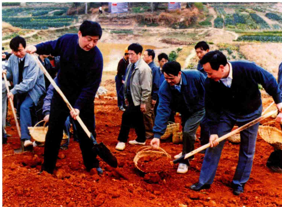
En décembre 1995, Xi Jinping, alors secrétaire adjoint du Comité du Parti pour la province du Fujian et secrétaire du Comité du Parti pour la municipalité de Fuzhou de cette province, travaillant pour la consolidation d'une digue anti-crues à l'aval du fleuve Minjiang.