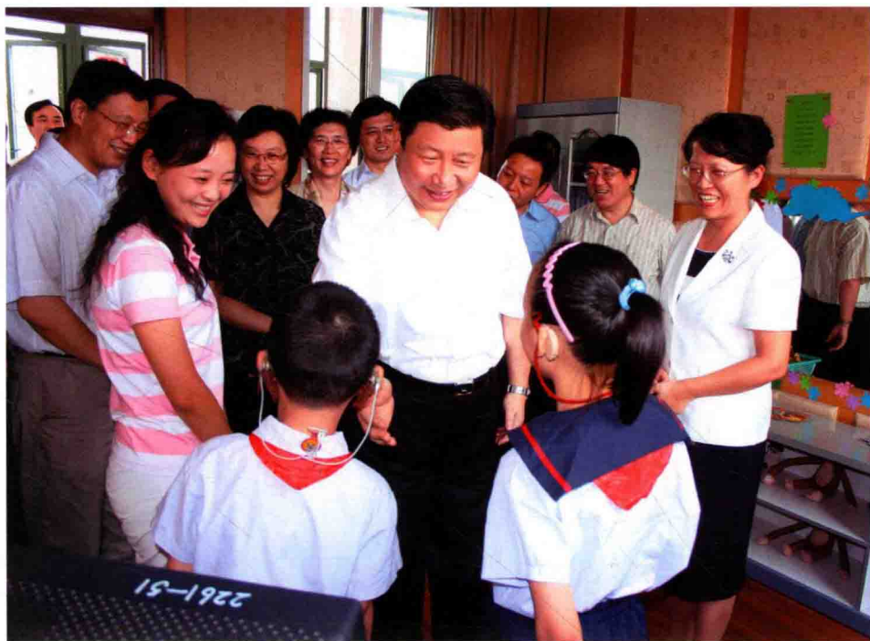
En septembre 2007, Xi Jinping, secrétaire du Comité du Parti pour la municipalité de Shanghai, s'entretenant avec des enfants malentendants à l'école Qiyin de l'arrondissement de Minhang, Shanghai.