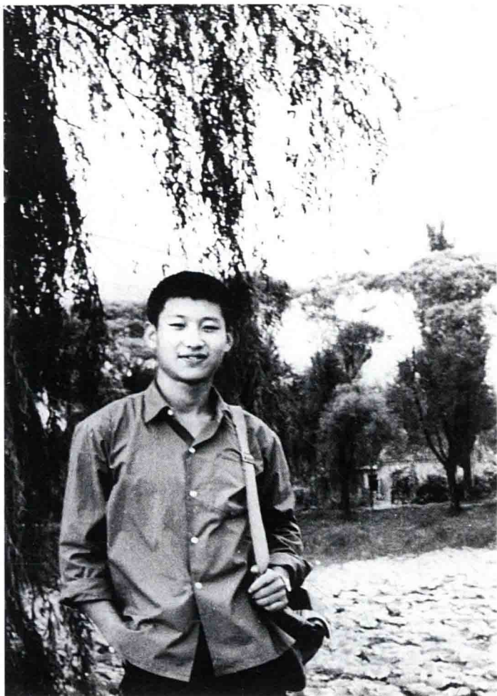
Xi Jinping, de retour, en 1972, d'un village où il travaillait comme jeune instruit, pour visiter ses parents à Beijing.