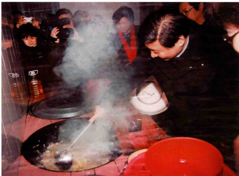
En janvier 2007, lors d'une visite au Foyer de personnes âgées du bourg Pingdu, district de Qingyuan dans le Zhejiang, Xi Jinping, secrétaire du Comité du Parti pour cette province, faisant la cuisine pour les résidents.