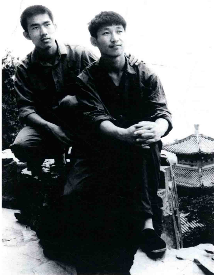
Xi Jinping (à droite), étudiant à l'Université Tsinghua en 1977.