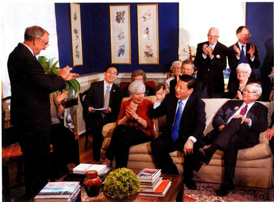
En février 2012, Xi Jinping, vice-président de la République populaire de Chine, avec ses amis rencontrés 27 ans auparavant dans l'Iowa, aux États-Unis.