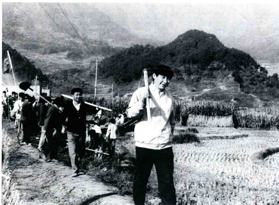
En 1989, Xi Jinping, secrétaire du Comité du Parti pour la préfecture de Ningde dans le Fujian, travaillant dans la campagne.