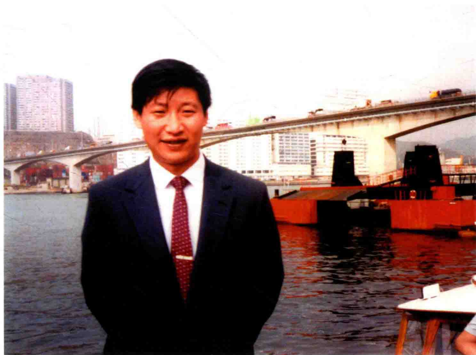
Xi Jinping, maire adjoint de Xiamen dans le Fujian, lors d'une visite à l'étranger.