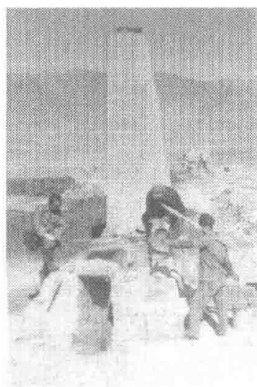
图1-2 土法生产硼砂的炉灶

早在明朝以前,我国西北就开始从天然硼矿制备硼砂。从目前已知的西北矿产资源可以推测,这种加工过程是在柴达木盆地的大柴旦湖区和马海一带进行的。