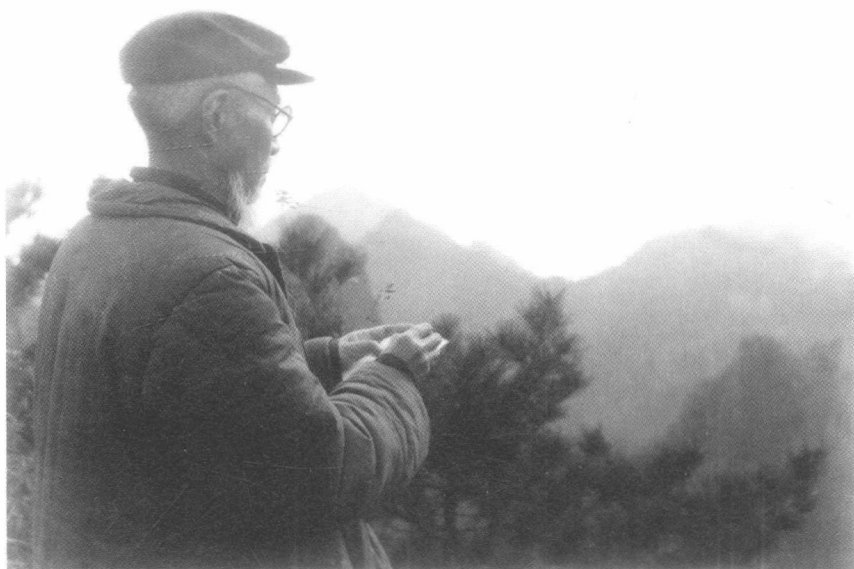
丰子恺在黄山画速写（摄于1961年春）