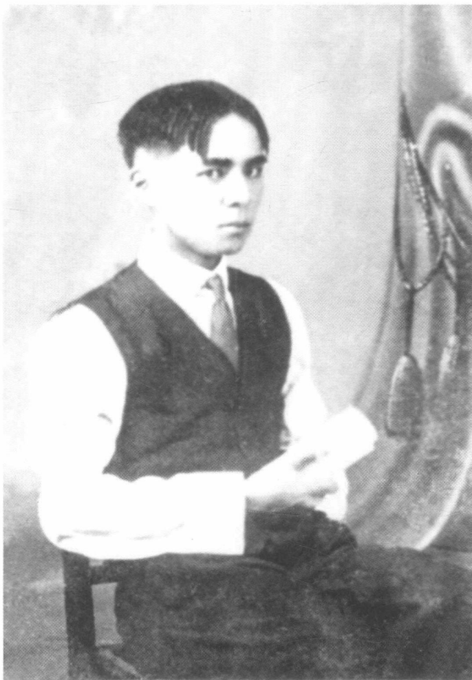
从日本归来时的丰子恺（约摄于 1921 年末）