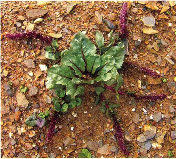
蓝花兔耳草 ག་བྱུར་ནག་པོ་ཟེལ་གཞོན་མ།