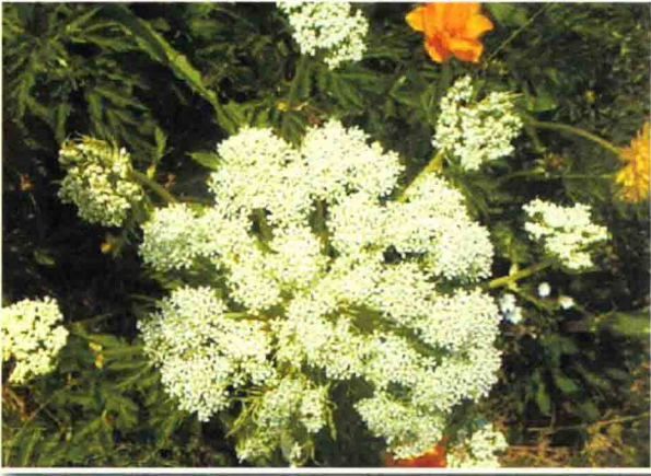
棱子芹 མ་གཤི་ཏ།