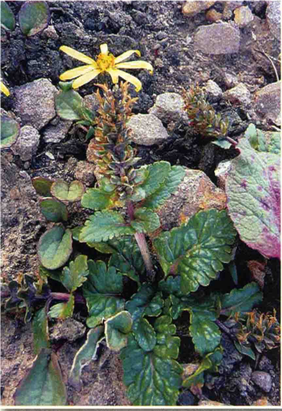
黄花兔耳草 ཉང་ལེན།