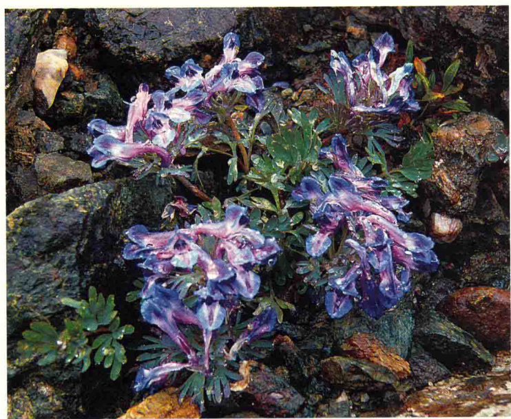
糙果紫堇 ལྷོང་རི་ཟེལ་པ།