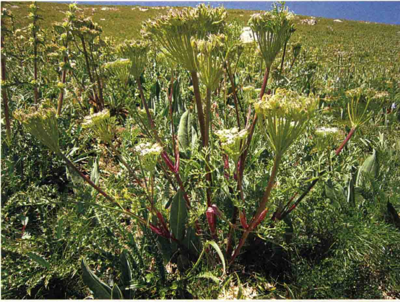
棱子芹 མ་གེ་ཏ།