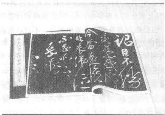
岳飞书武侯出师表拓本

中称：南宋末年，临安说话艺人王六大夫即以敷衍讲说《复华篇》和《中兴名将传》著名。岳飞作为南宋中兴名将中最杰出的人物，自然成为《中兴名将传》里的主要人物。而《复华篇》，顾名思义是演说北宋灭亡之后南宋小朝廷创立及南宋军民抗击金兵的故事，当然也会涉及岳飞以及岳家军的战功与事迹。当王六大夫讲说岳飞、韩世忠时，总是“听者纷纷”。随着有关岳飞的故事辗转流传于民间，并随着百姓大众的爱憎而屡加增删，其他人的一些事迹，也被附会、集中到岳飞身上。于是，作为历史人物的南宋大将岳飞便逐渐被敷衍成一位文艺作品中的艺术形象。