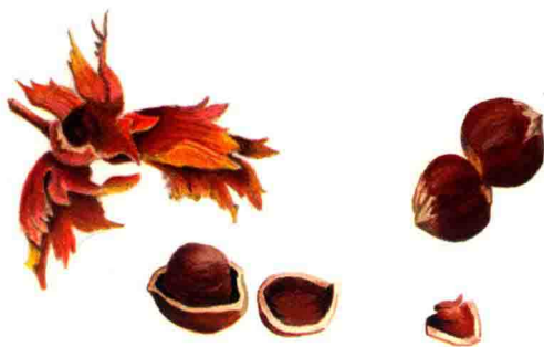
彩色铅笔是描绘榛果干燥多叶的苞片和果实的理想工具。