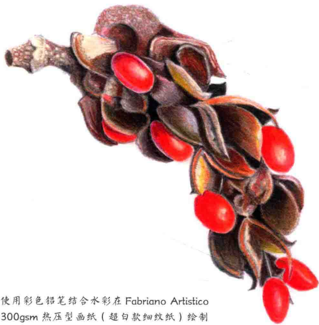
使用彩色铅笔结合水彩在 Fabiano Artístico 300gsm 热压型画纸(超白款细纹纸)绘制的木兰花种子穗。