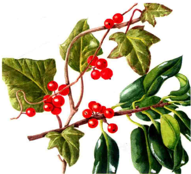
学习调配绿颜色。绿色是令初学者最为感到棘手的一种配色。