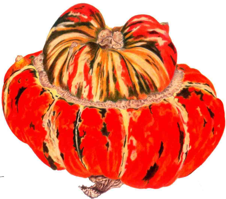
右图是一幅先用水彩上色，再用彩色铅笔进一步修饰的优秀作品。

剪下几段塑料吸管作为笔头的保护套。毛尖出现参差不齐的情况时，可以用手指轻轻地捋顺，然后用肥皂水将其泡软后再晾干。使用前要把笔尖上的肥皂水清洗彻底。