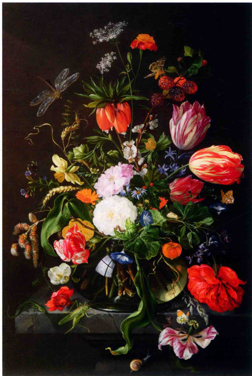
由 17 世纪德国画家扬·戴维茨·德·希姆（1606-1684 年）绘制的静物花卉图案。

如今，在 21 世纪，我们从几代艺术家和科研人员的专业知识中获得了丰富的收益，绘画时能够把最好的工具或材料常备手边。