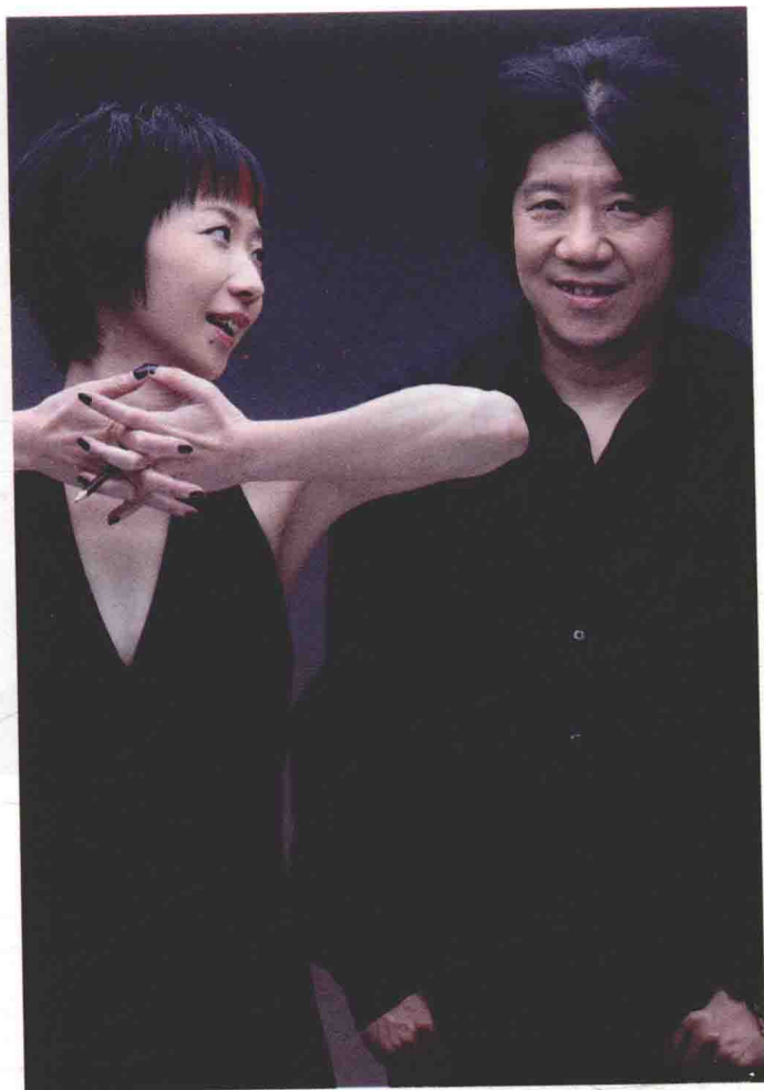
2010年10月，《柔软》排练期间， 编剧廖一梅和导演孟京辉