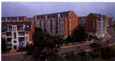
↑ 建筑依山的形式有两类，一类是“土包屋”，另一类是“屋包山”。

六朝古都南京滨临长江，四周是山，有虎踞龙盘之势。其四边有秦淮河入江，沿江多山矶，从西南往东北有石头山、马鞍山、幕府山，东有钟山，西有富贵山，南有白鹭洲和长命洲形成夹江之势。