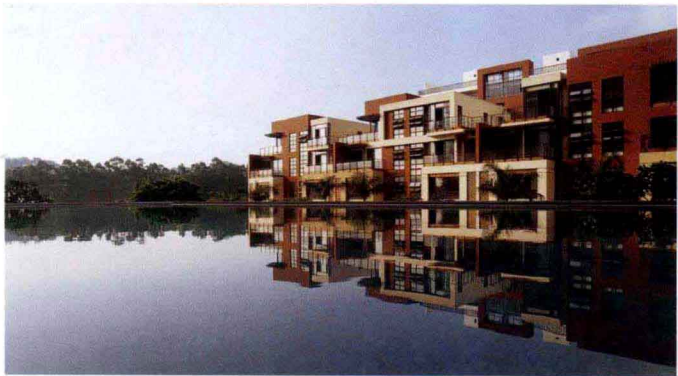
↑ 因地制宜，即根据环境的客观性，采取适宜于自然的生活方式。

中国地域辽阔，各地气候差异很大，土质也不一样，建筑形式亦不同。西北干旱少雨，人们就选择穴居式窑洞居住，窑洞位多朝南，施工简易，不占土地，节省材料，防火防寒，冬暖夏凉，人可长寿，鸡多下蛋。西南潮湿多雨，虫兽很多，人们就建造栏式竹楼居住。《旧唐书·南