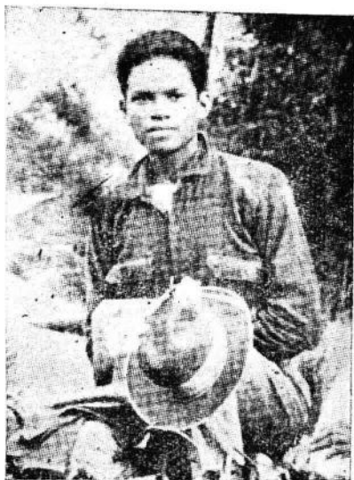
十七歲時的麥格塞塞