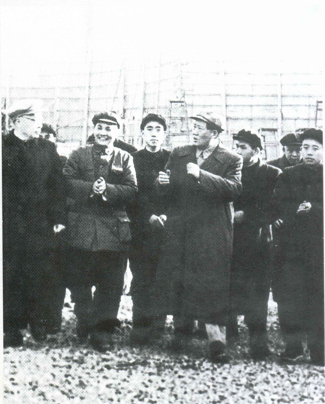
[2] 毛泽东在陈毅陪同下视察江南造船厂