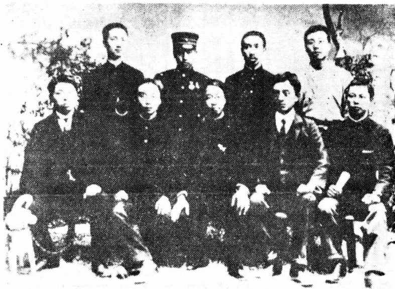
黄兴与华兴会友人在东京合影