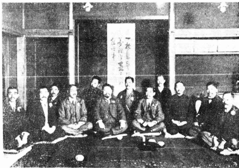
黄兴与孙中山同日本朋友在上海合影