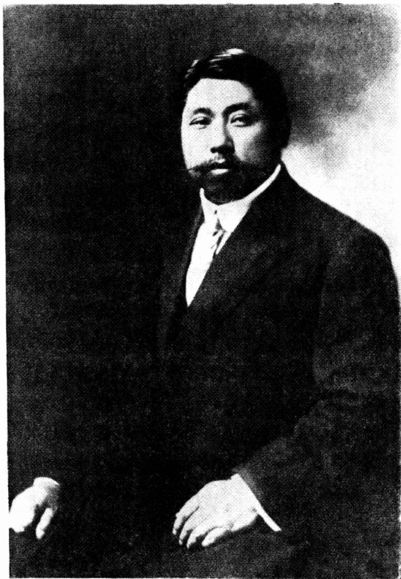
黄 兴 像