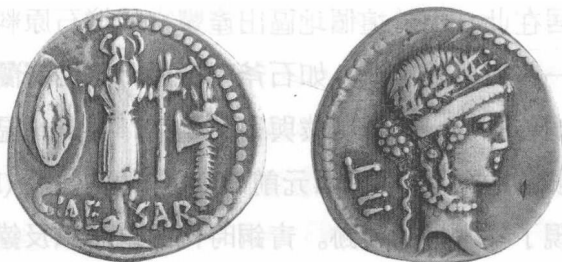
圖 1：凱撒征服尼德蘭地區後所鑄造的硬幣

羅馬人為尼德蘭地區的文字歷史揭開了序幕，他們的文化光環，一路從地中海地區閃耀到北海。西元前 57 年，凱撒 (Julius Caesar) 率領了其訓練有素之軍隊到來，逐漸征服了部分尼德蘭地區。羅馬史家塔西圖斯 (Publius Cornelius Tacitus) 認為，尼德蘭地區相對於羅馬，真是一個偏遠蠻荒的邊疆之地。不過羅馬人終究在這個地區建立了行省與城鎮，並帶給尼德蘭地區所謂的「文明」。尼德蘭地區的比利其 (Belgae，即比利時) 人，曾嘗試反抗羅馬人的統治。在凱撒的著作《高盧戰記》中，曾描寫比利其人最悍勇的抵抗。日耳曼人中的一支巴達維亞人 (Batavians) 也曾於西元 69 年，由巴達維亞人的領袖西比利斯 (Claudius Civilis) 為