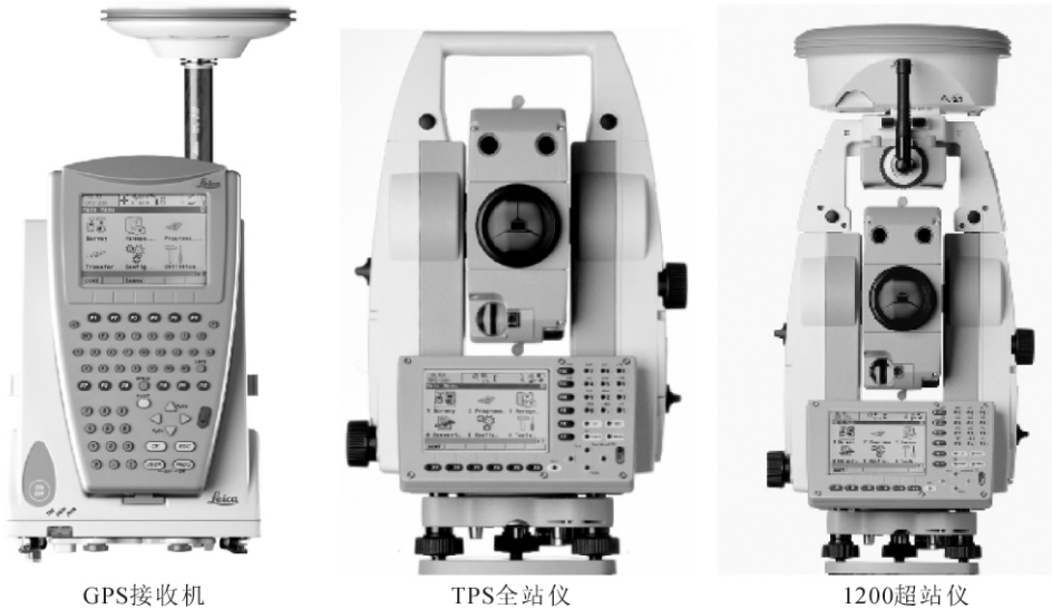
图 1-2 SmartStation

电子经纬仪与电磁波测距仪的集成产生了电子全站仪。这种电子全站仪在大地测量及工程测量中发挥着重要作用，但也有一定的局限性。比如，必须在有控制点的情况下才能进行施工放样及测图等，另外作业影响范围很有限。GPS的优点是大家共知的，但由于其必须保持卫星信号通畅条件下才能作业，因此在楼宇林立的城区，其作业将受到干扰或者不能作业。为了发挥两种技术的优点和补偿各自的缺陷，于是将它们集成在一起的全功能的超站仪就应运而生了。这就是 TPS 和 GPS 的集成——徕卡系统 1200—斯美特全站仪(SmartStation)(见图 1-2)。