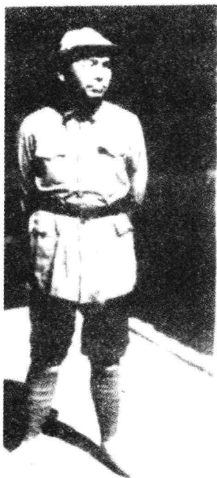
1937年1月,红军敌前总指挥彭德怀在陕西三原留影