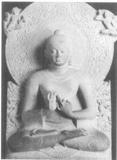
● 釋迦牟尼佛初轉法輪像

接着，佛陀獨自到迦耶山上，度化三迦葉兄弟。三迦葉原是外道的領袖，大哥哥名優樓頻那迦葉，有五百徒眾；二弟名伽耶迦葉，有二百五十徒眾；三弟名那提迦葉，也有二百五十徒眾。這樣，總共一千個徒眾都隨着師父集體出家，皈依了佛陀，從而大大提高了