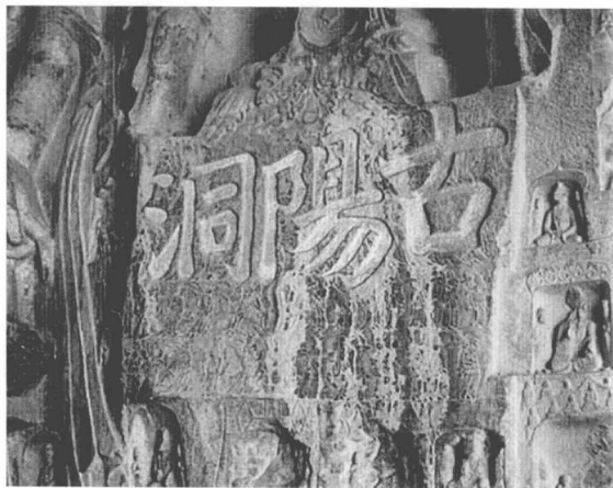
● 洛陽龍門石窟古陽洞

中國佛教塑造釋迦牟尼「八相成道」形象最著名的遺跡為洛陽龍門石窟古陽洞中的雕刻，是一套完整的釋迦成道過程。古陽洞的造像題記書法棱角分明，字形樸拙，結構緊密，硬挺有力，著名的「龍門二十品」，其中有十九品在這座洞裏。