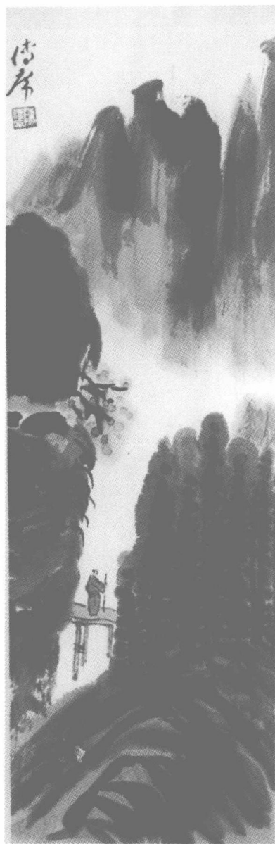
深山觅诗 陈传席作