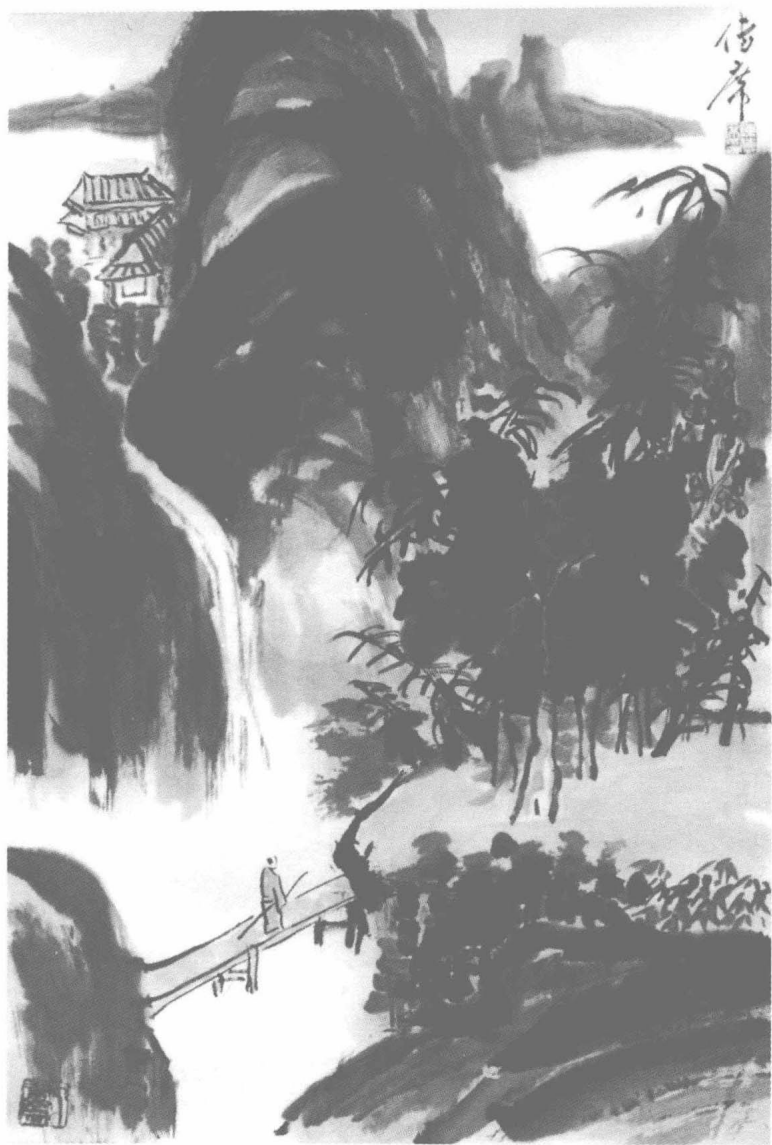
山水清音 陈传席作