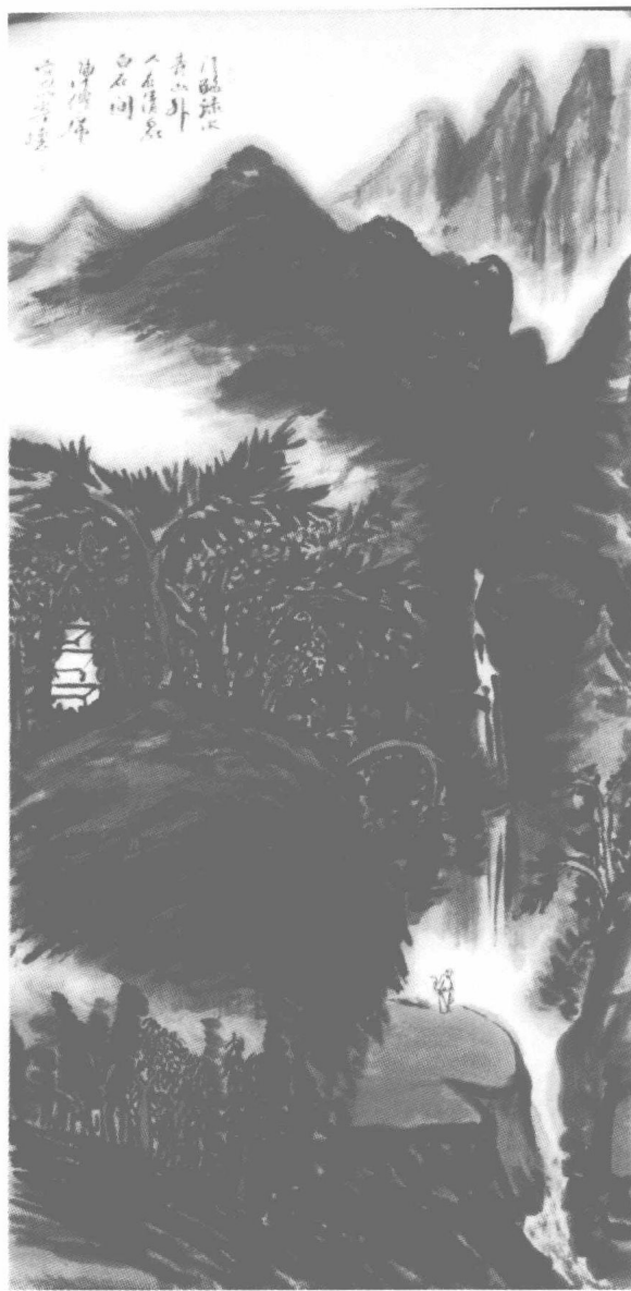
门临绿水 陈传席作