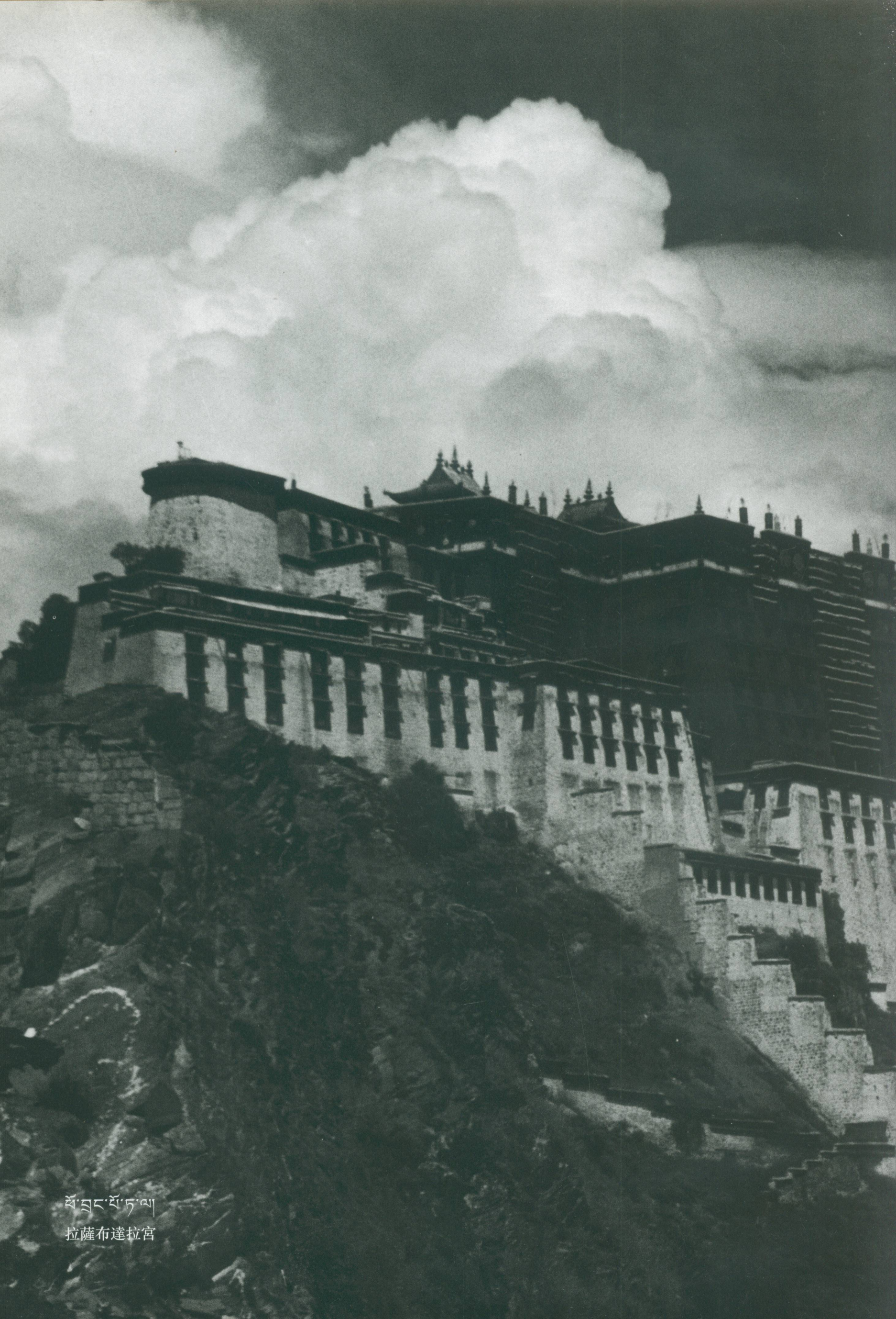
ཕོ་བླང་ཕོ་ཏ་ལ། 拉薩布達拉宮