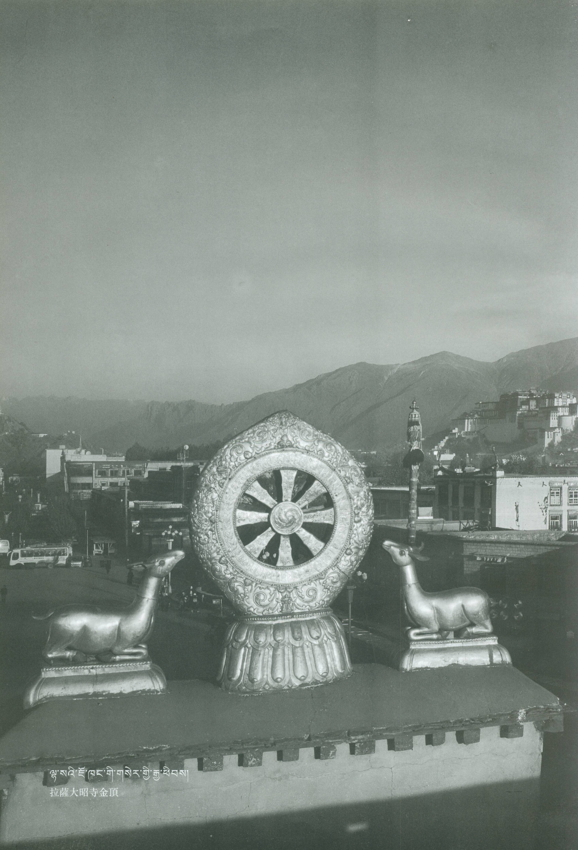
ལྷ་སའི་ཇོ་མང་གི་གསེར་གྱི་རྒྱ་མཐོ་མཐོ་ 拉薩大昭寺金頂