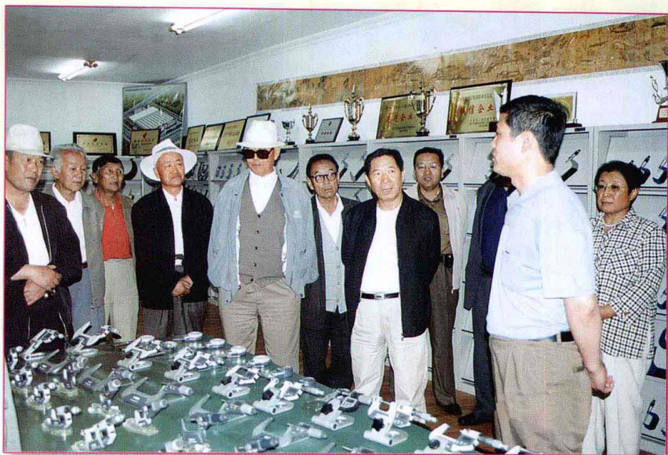
图为海北州政协委员、政协老同志视察西宁经济开发区。