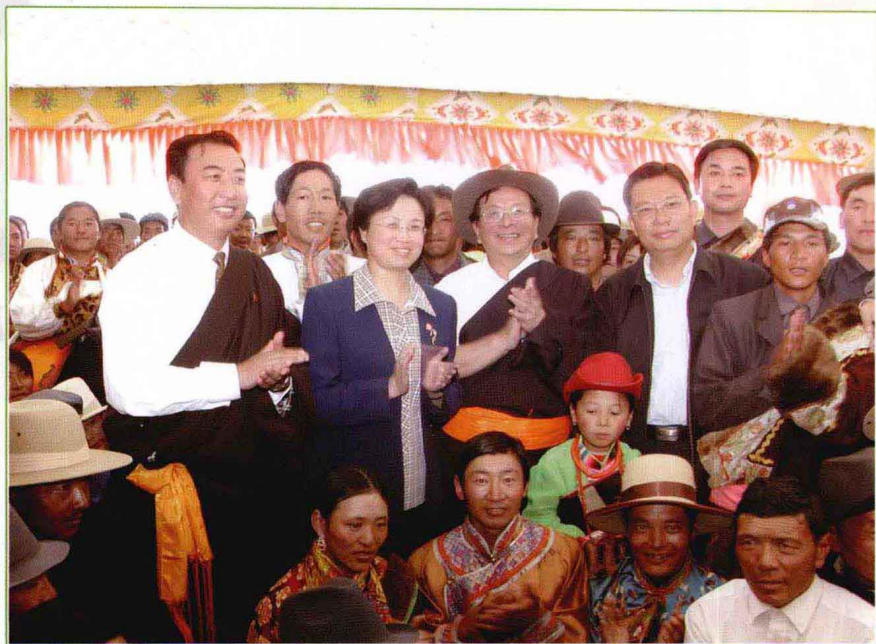
曾庆红副主席（中）和省州领导与牧民群众合影。