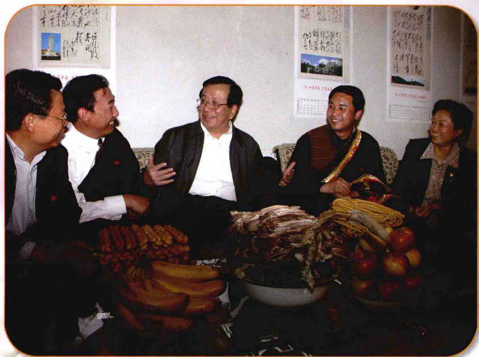
在牧民家中，曾庆红副主席（中）与省委书记赵乐际（左一）、省委副书记、省长宋秀岩（右一）、州委书记旦科（左二）、州委副书记、州长严金海（右二）谈笑风生。