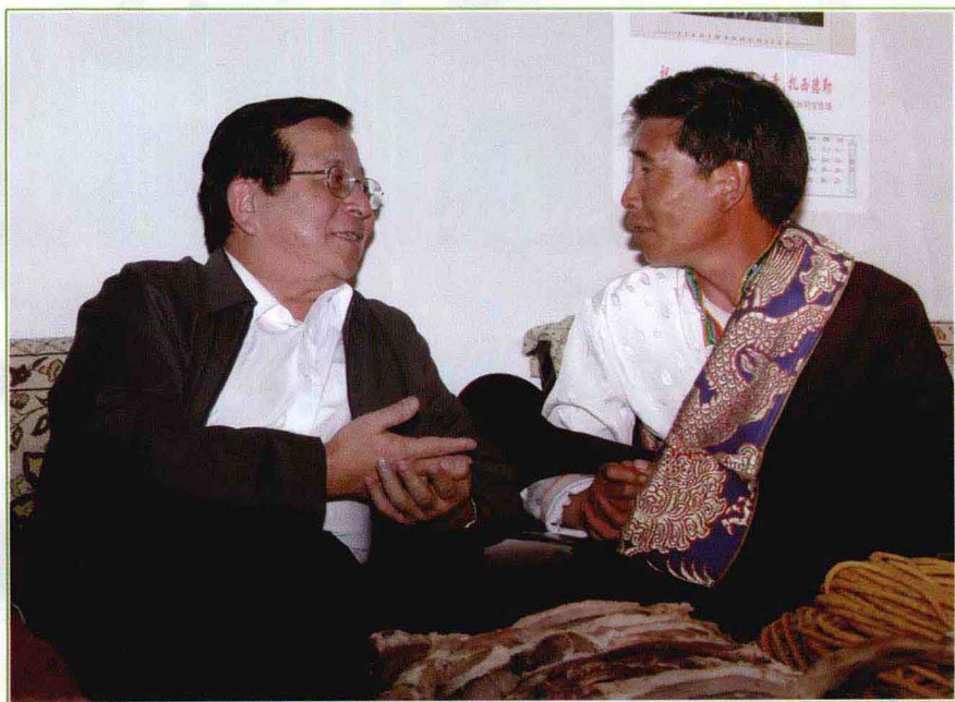
同宝牧场牧民吉合宝向曾庆红副主席介绍生产生活情况。