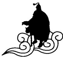
袁绍：关东义军盟主