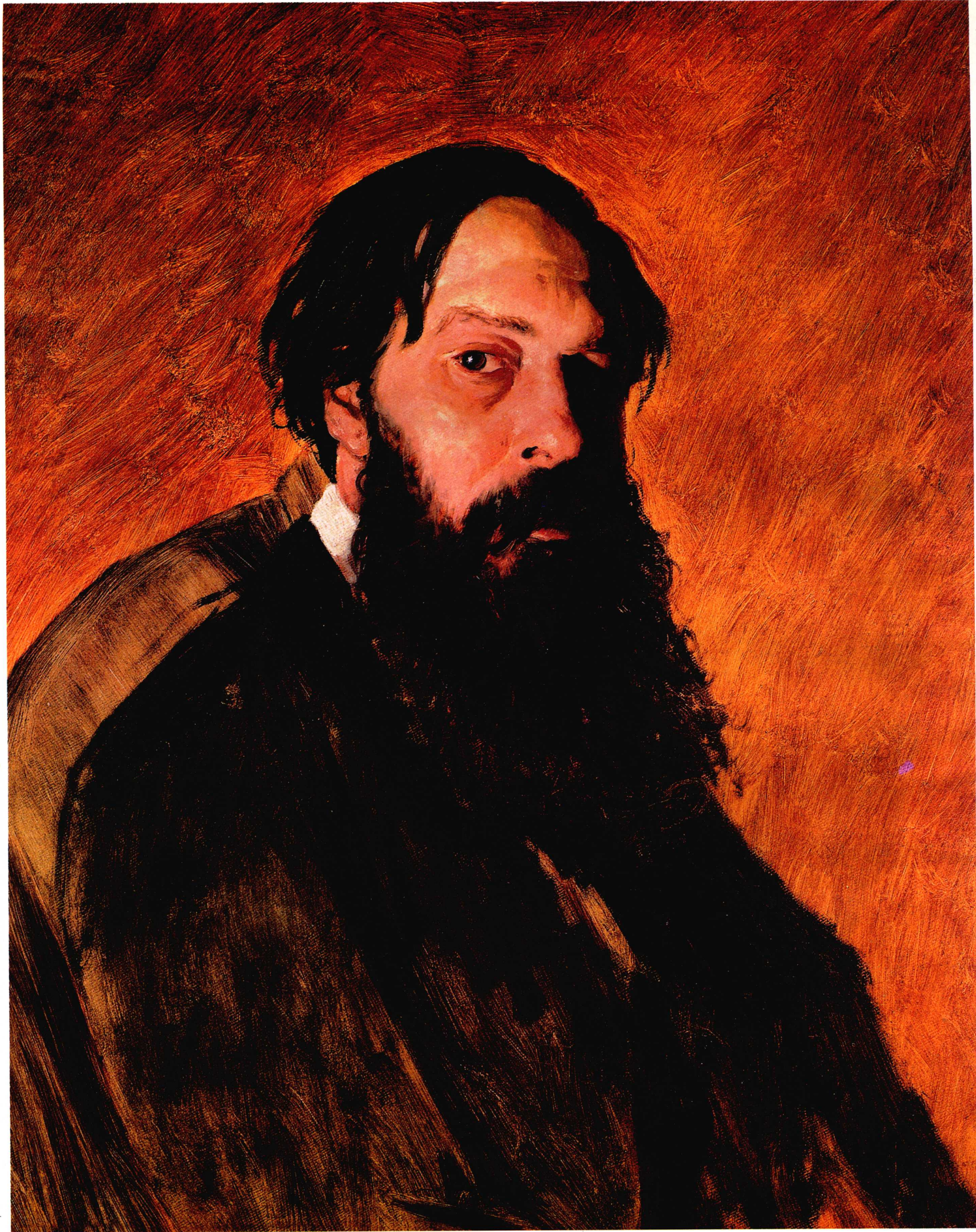
萨符拉索夫肖像 71cm × 57cm