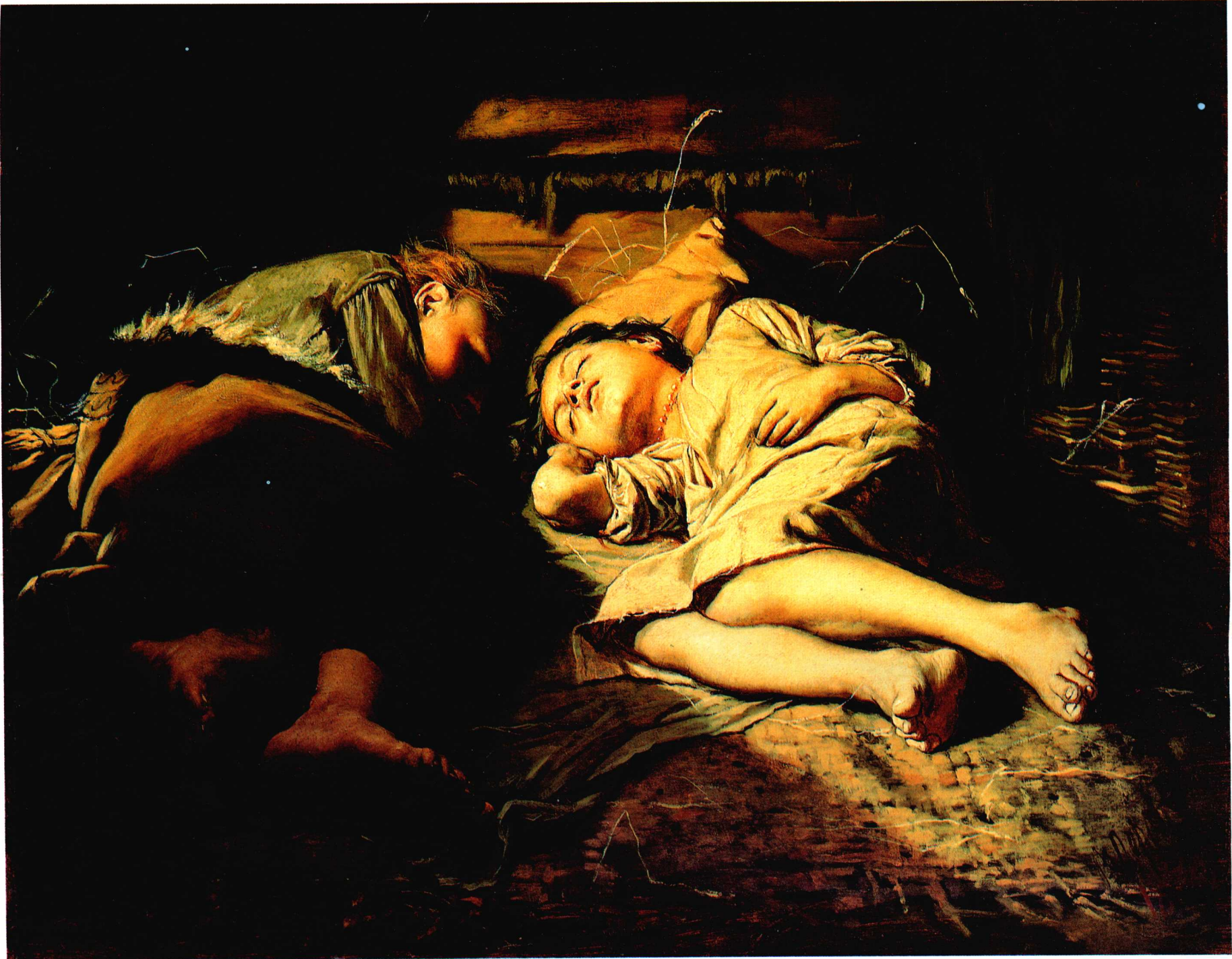
睡梦中的孩子 1870年 53cm × 61cm