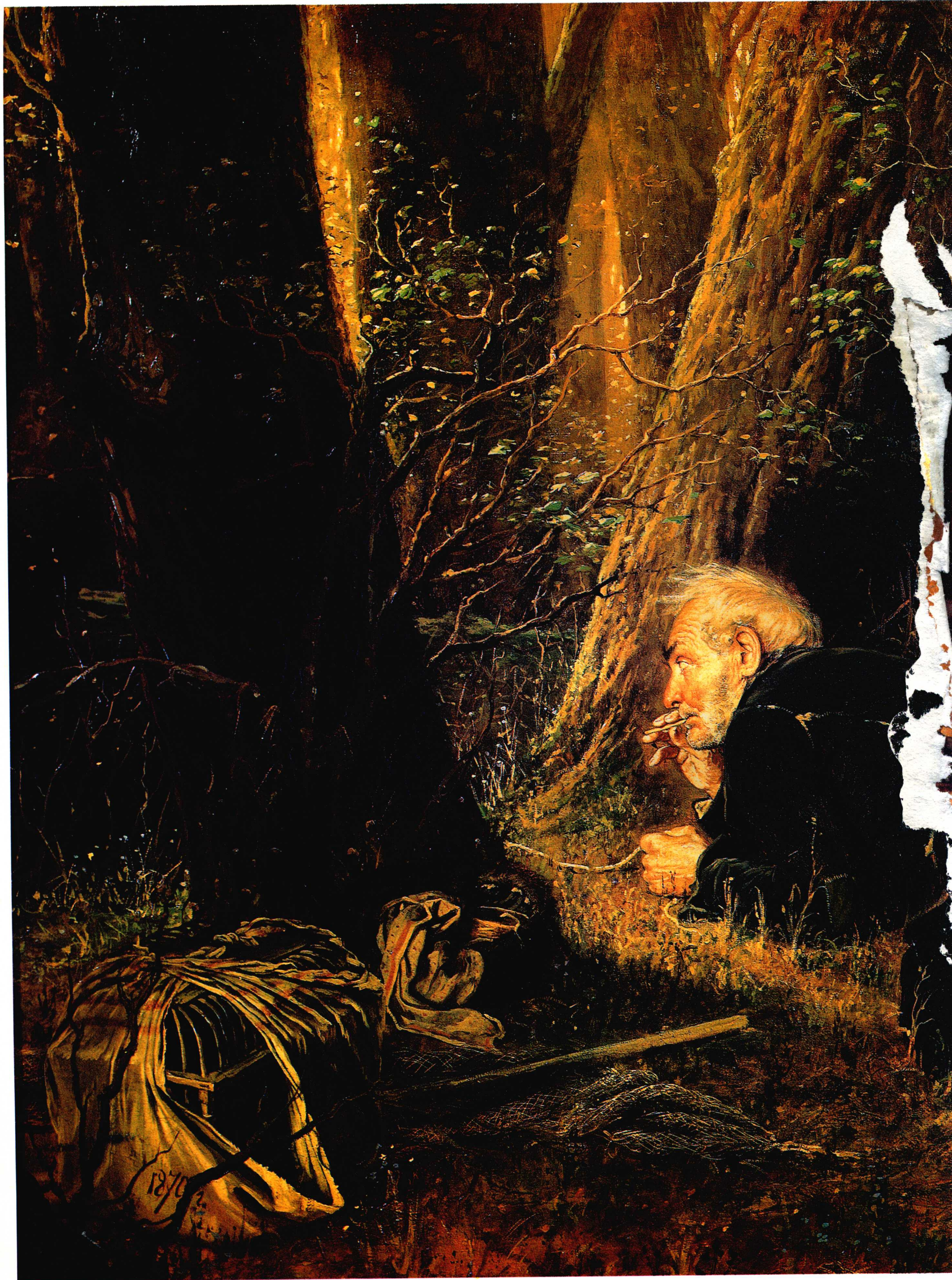
捕鸟人 1870年 82.5cm × 126cm