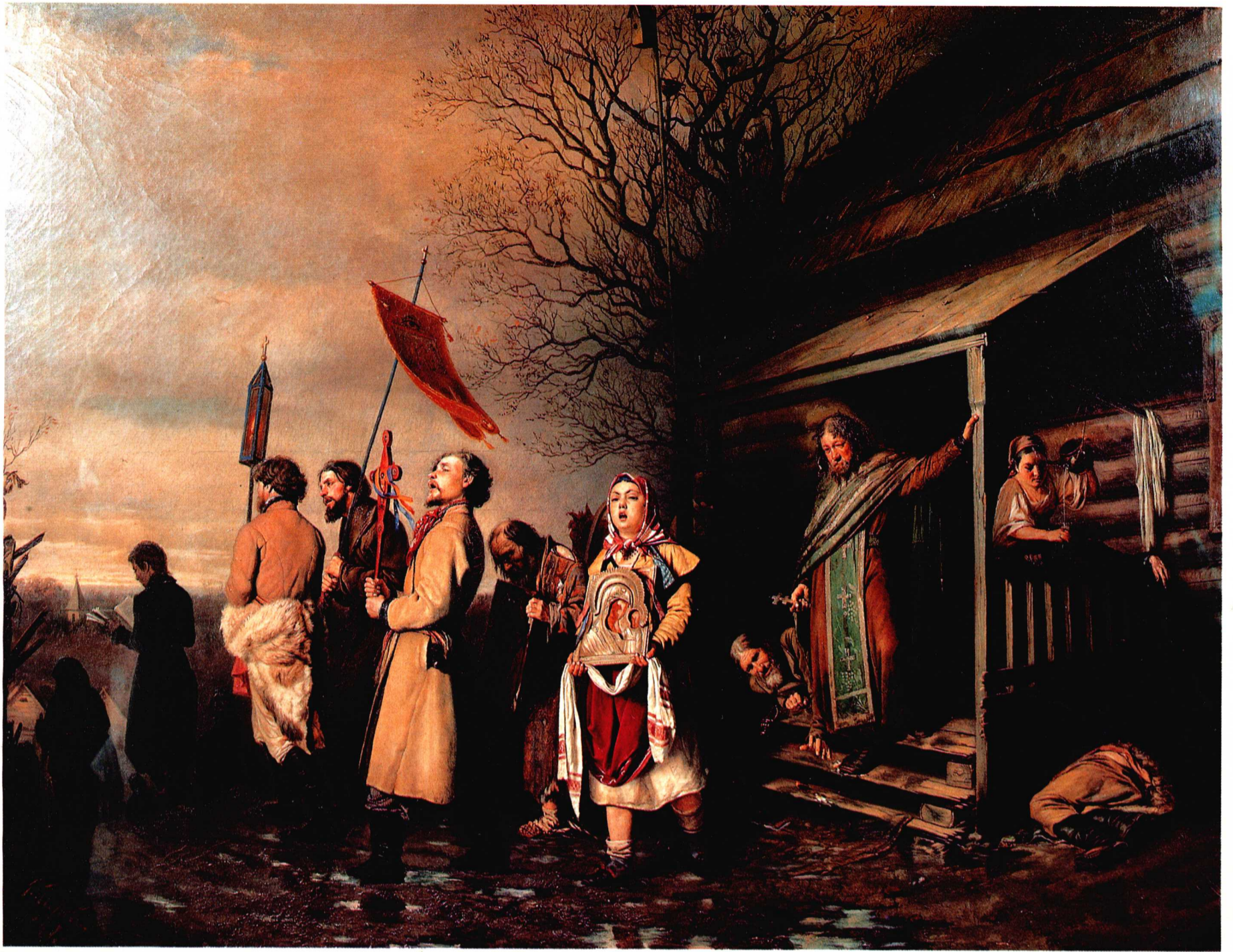
复活节的乡村宗教行列 1861年