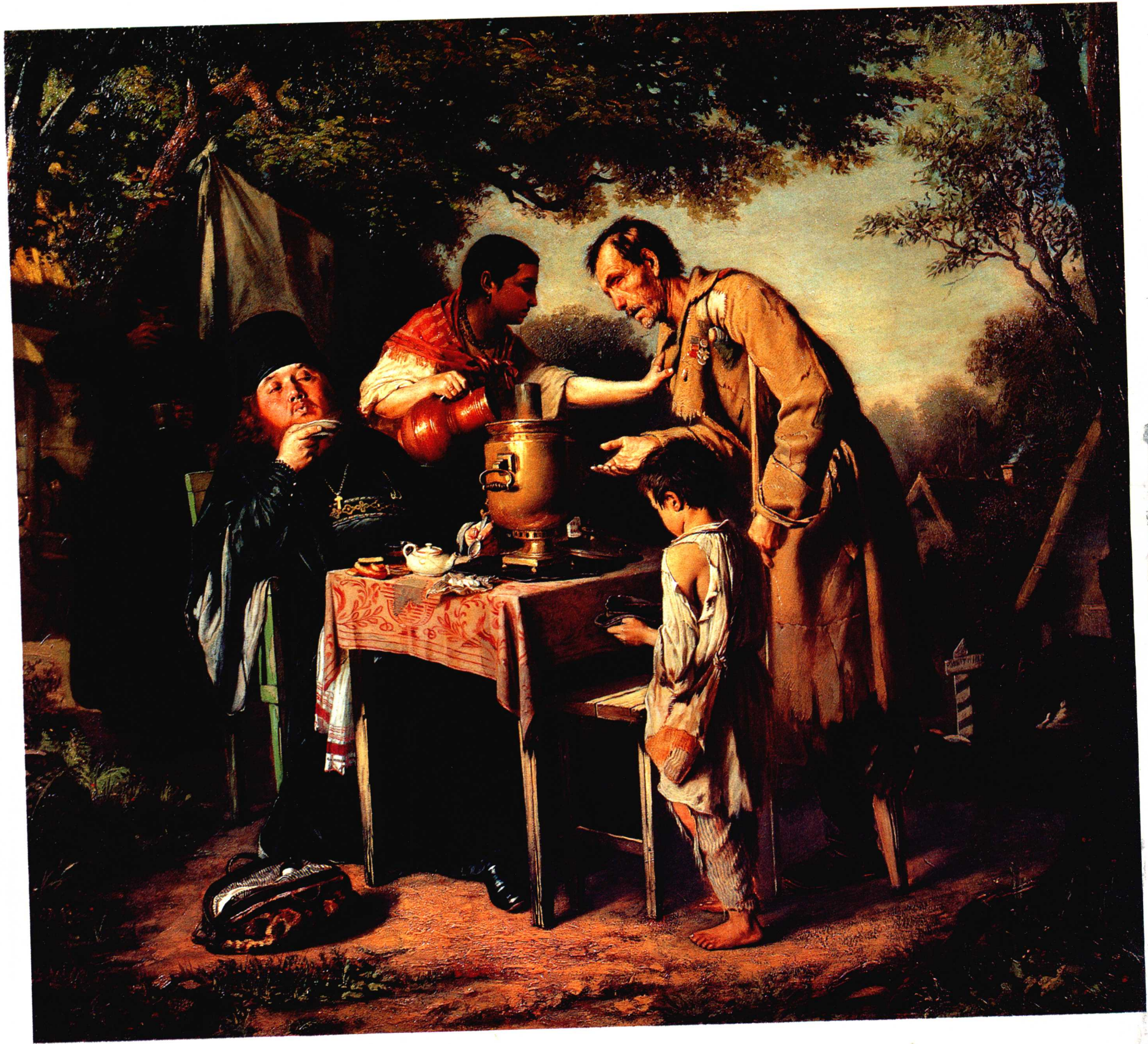
莫斯科郊区梅蒂希的午茶 1862年