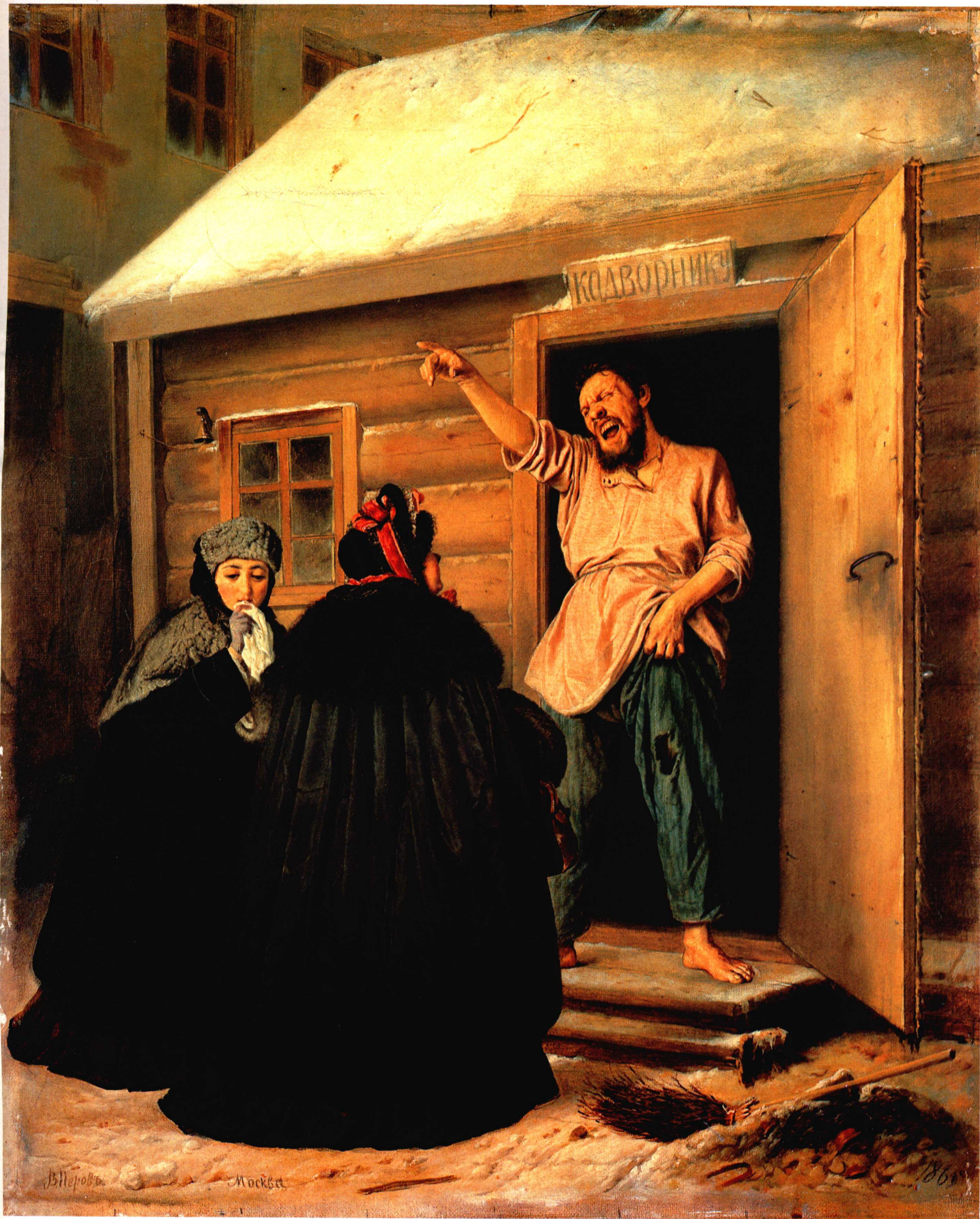
客栈老板 1865年 39.2cm × 32.8cm