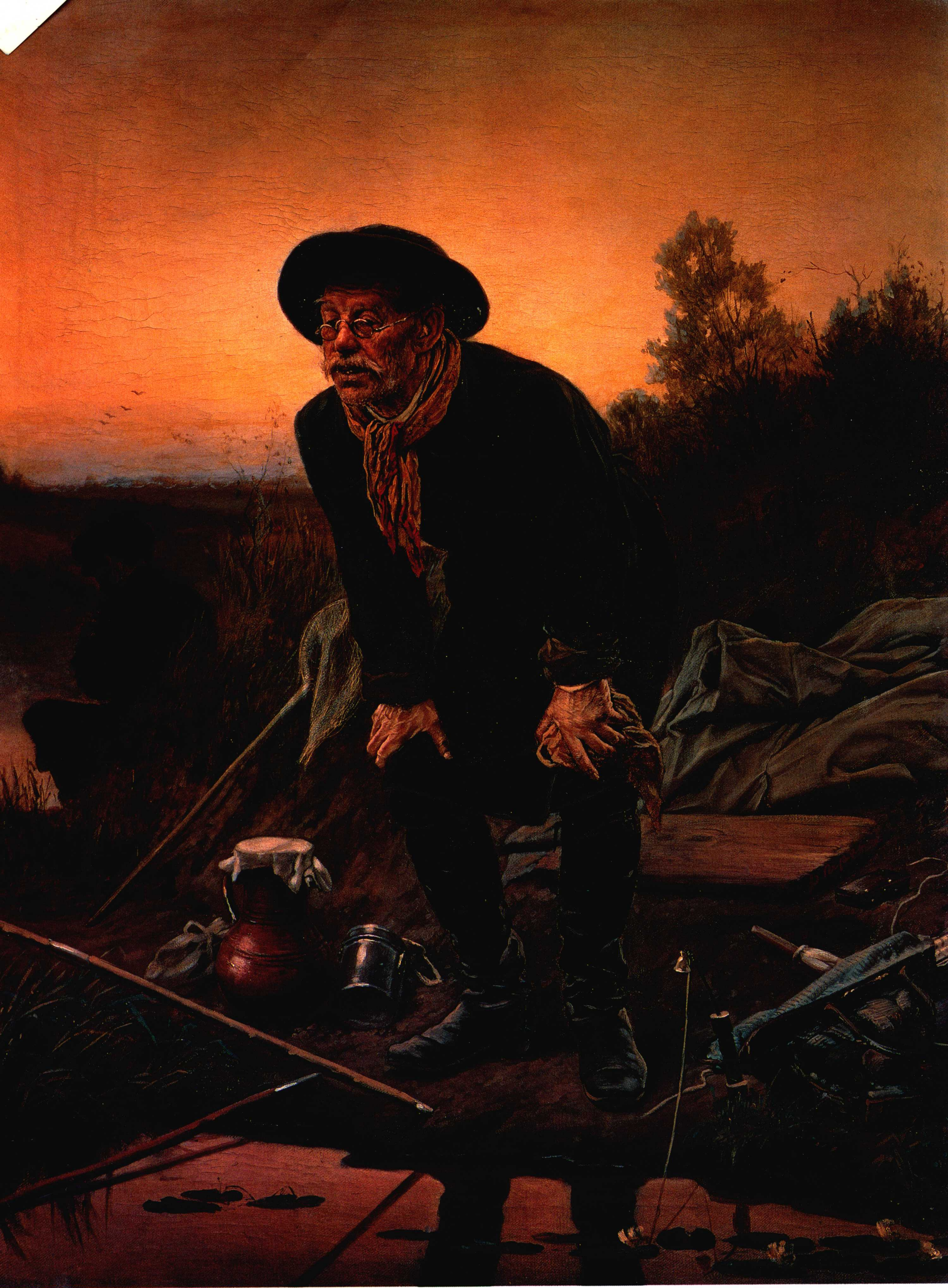
垂钓者 1871年 91cm × 68.7cm