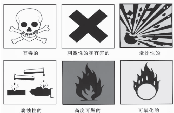
图 1-1 危险化学药品分类所用标志