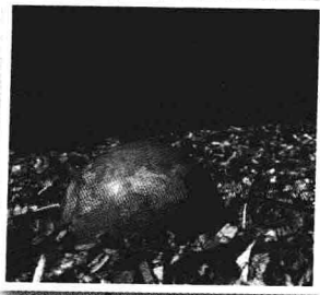
Mixed Garbage Overflowing ...