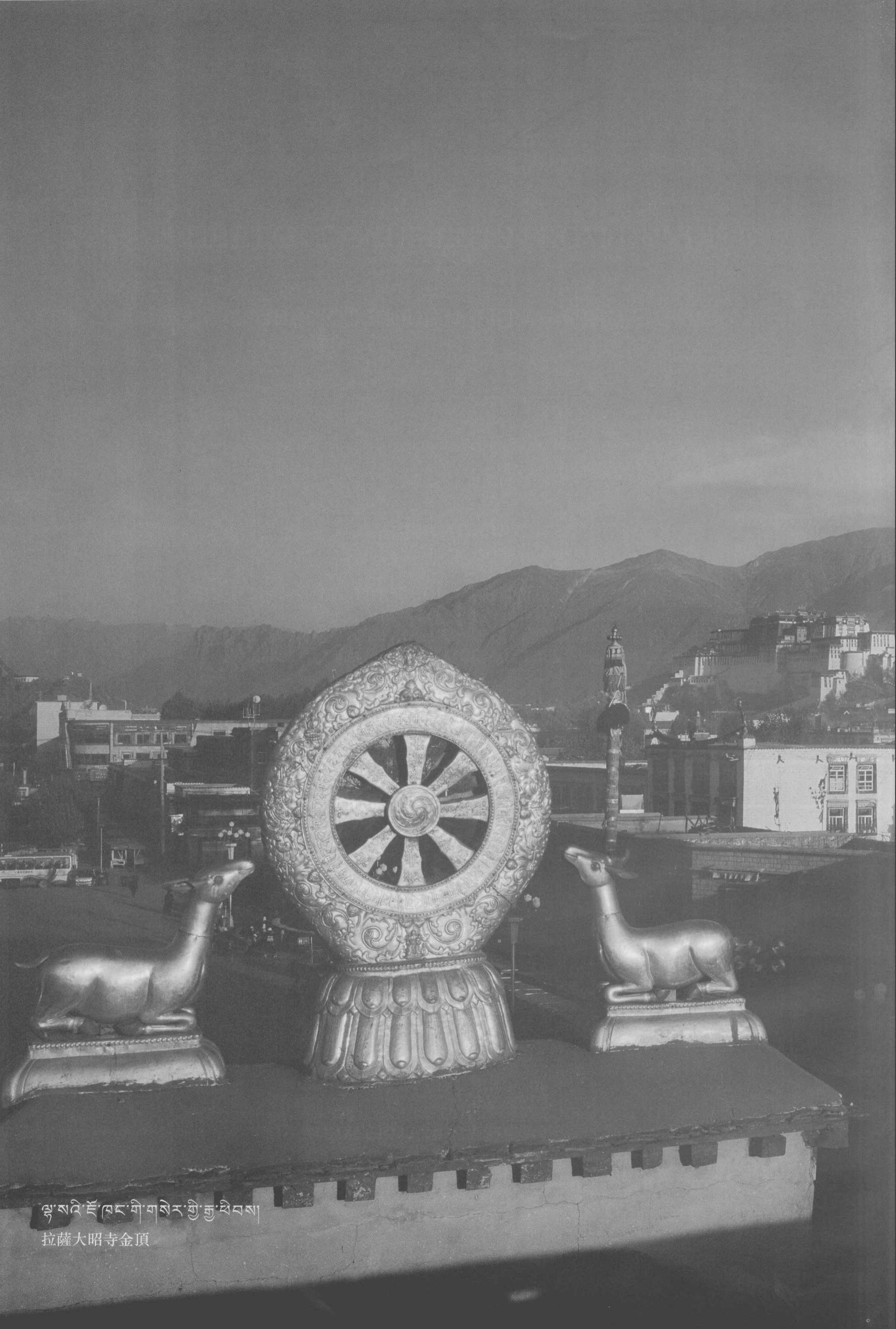
ལྷ་སའི་ཇོ་མང་གི་གསེར་གྱི་རྒྱ་མཐོང་། 拉薩大昭寺金頂