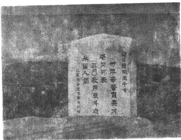
阎述诗在北京八宝山的墓碑