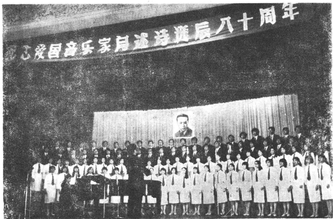
纪念爱国音乐家阎述诗诞辰八十周年大会