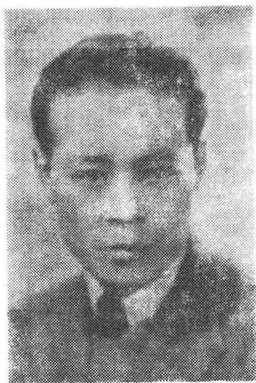
爱国音乐家阎述诗