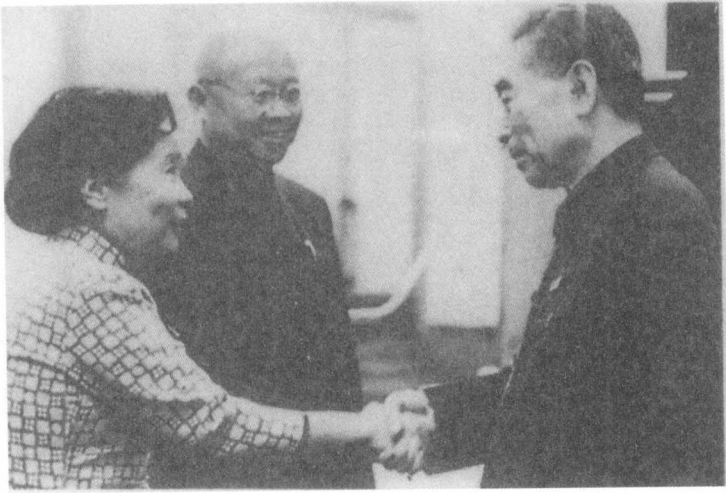
周恩来同志会见袁家骝、吴健雄