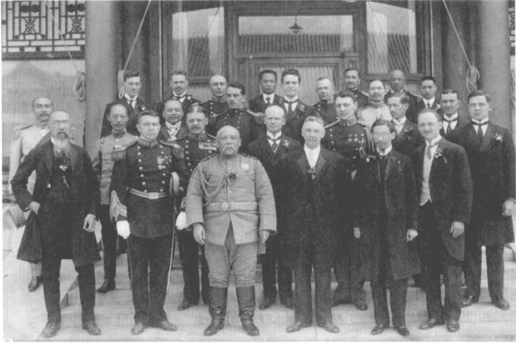
辛亥革命时期袁世凯与各国使节