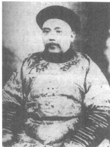
内阁总理大臣袁世凯