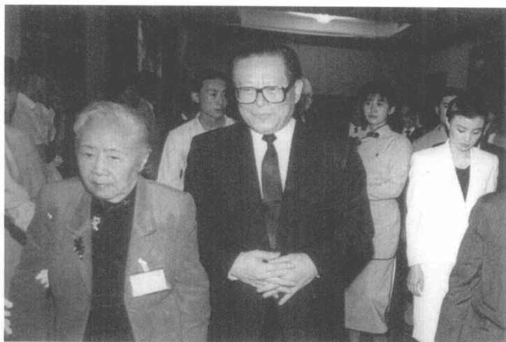
江泽民同志会见袁家骝夫人吴健雄