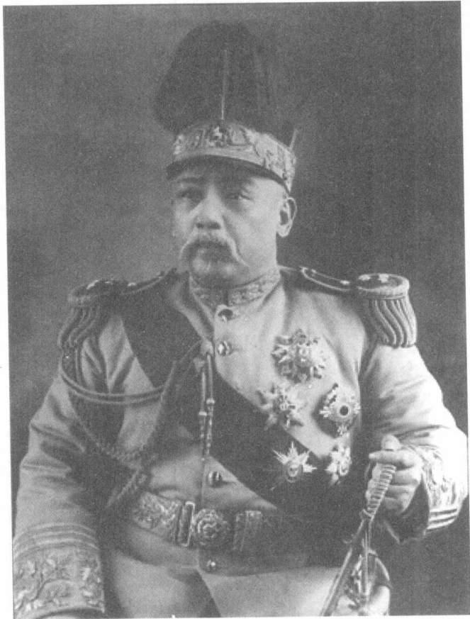
中华民国大总统袁世凯