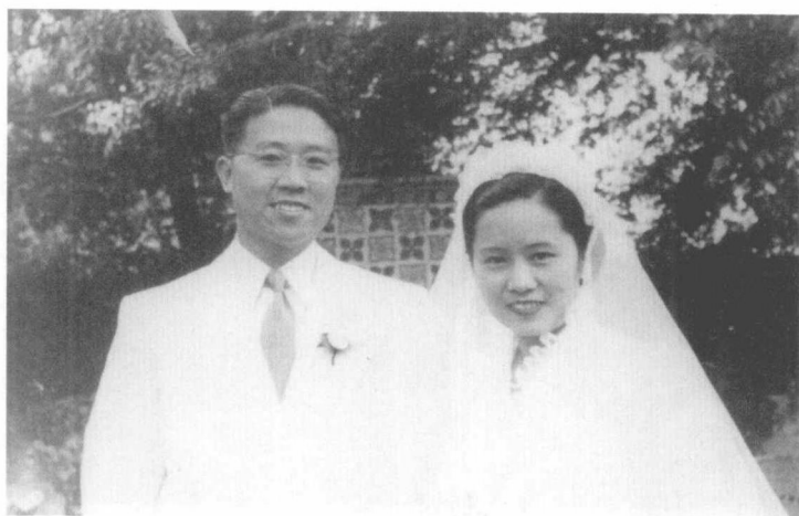
1942年5月30日袁家骝、吴健雄结婚照