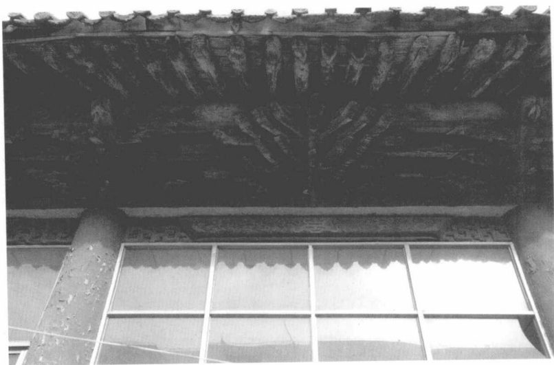
淮阳袁甲三祠堂的斗拱