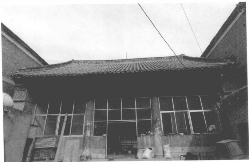
淮阳袁甲三祠堂现状