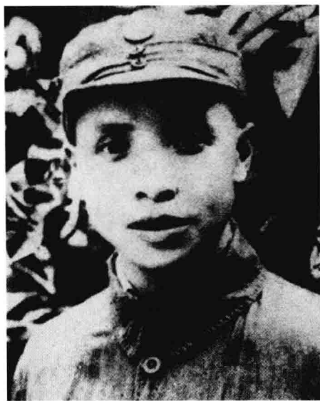
浙东区党委书记、新四军浙东游击纵队政委谭启龙