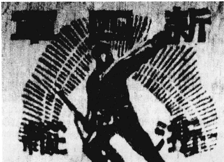
新四军浙东游击纵队臂章(正面)