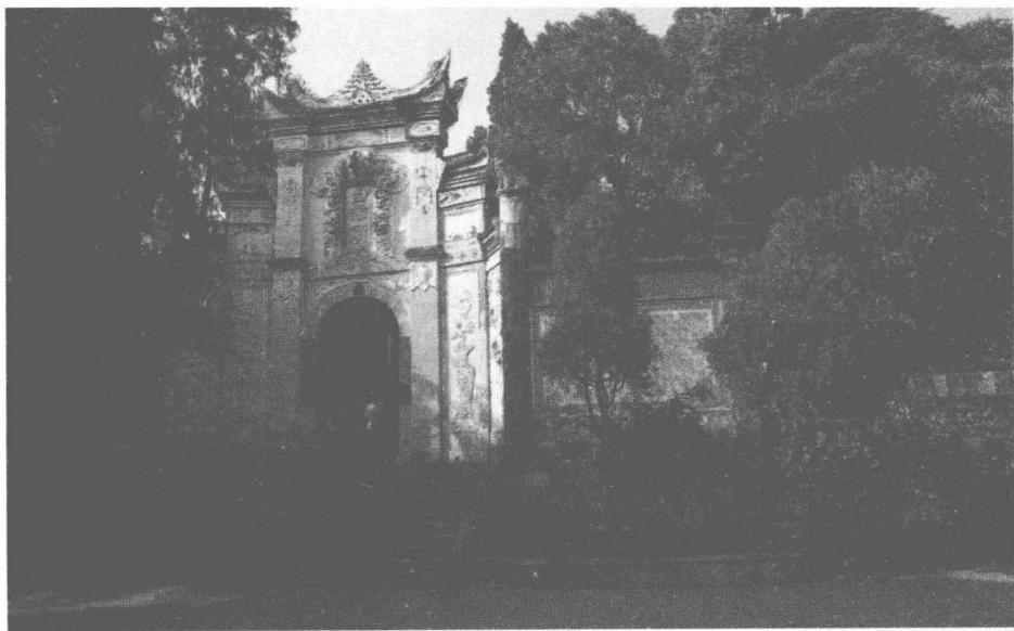
图 1-3 瞿塘峡口白帝庙

由此诗可以看出，苏轼初登政坛，他的非传统意识就已经溶进血脉。他没有天下归刘的所谓“正统思想”，而是发自内心地赞美那些靠自身能力征伐天下的英雄。