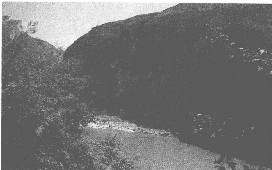
图 1-1 苏轼出川必经之地——三峡夔门

此诗所云“奔腾过佛脚”可见当时水势浩荡。年轻的苏轼心潮如江流滚滚，他对前路充满期待和向往。