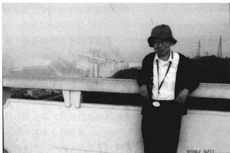
2005 年段义孚访华时在三峡大坝留念